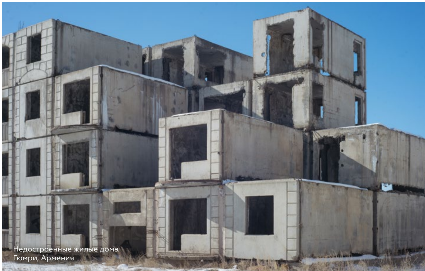
Недостроенные жилые дома Гюмри, Армения