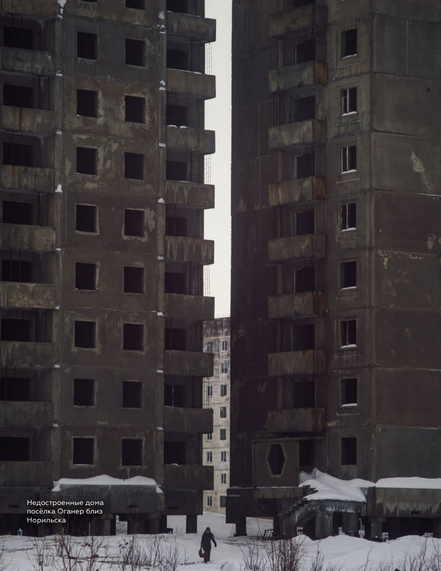
Недостроенные дома посёлка Оганер близ Норильска