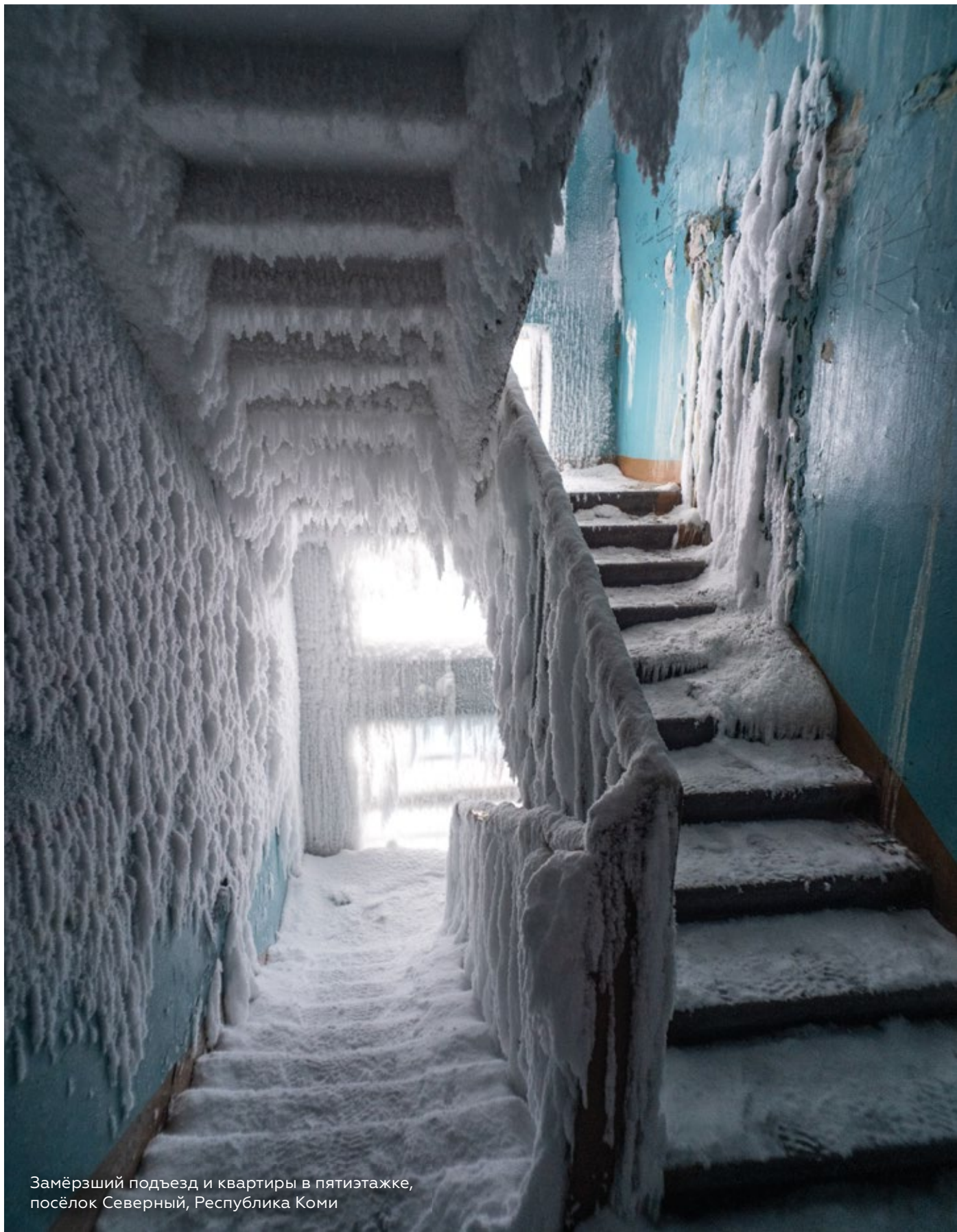
Замёрзший подъезд и квартиры в пятиэтажке, посёлок Северный, Республика Коми