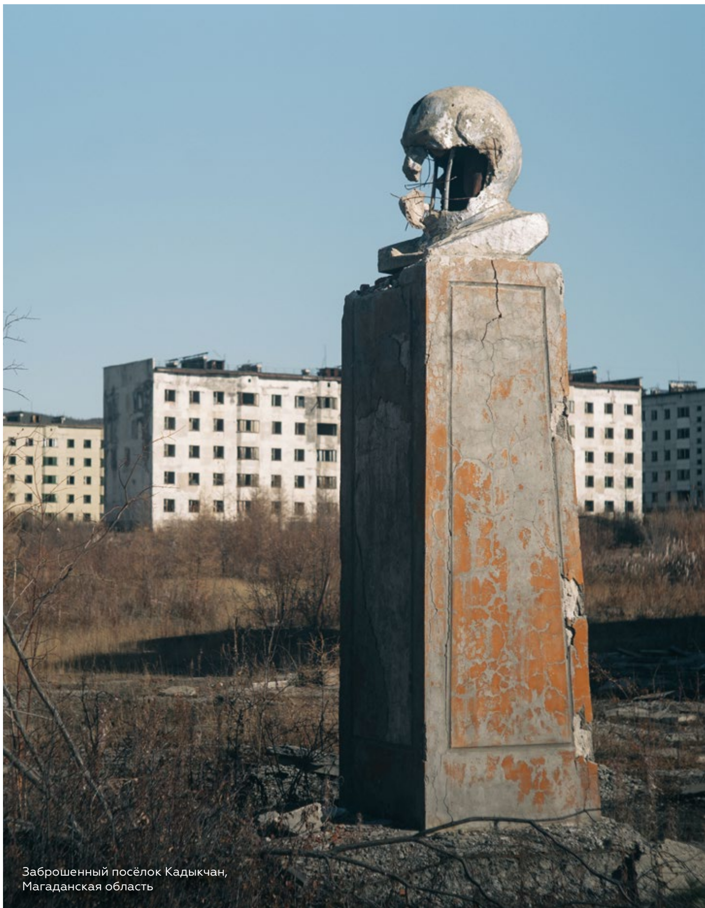
Зброшненны псёлк Кадыкчан, Магаданская абласць