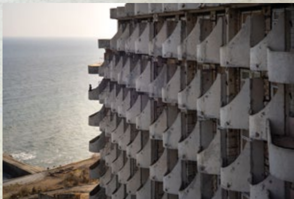
Общественные здания 124