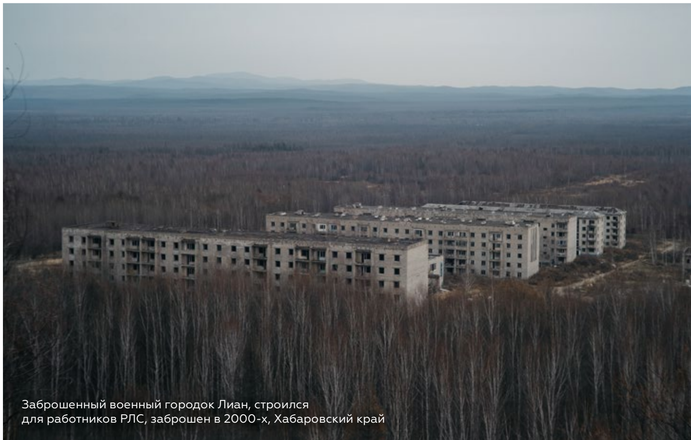
Заброшенный военный городок Лиан, строился для работников РЛС, заброшен в 2000-х, Хабаровский край