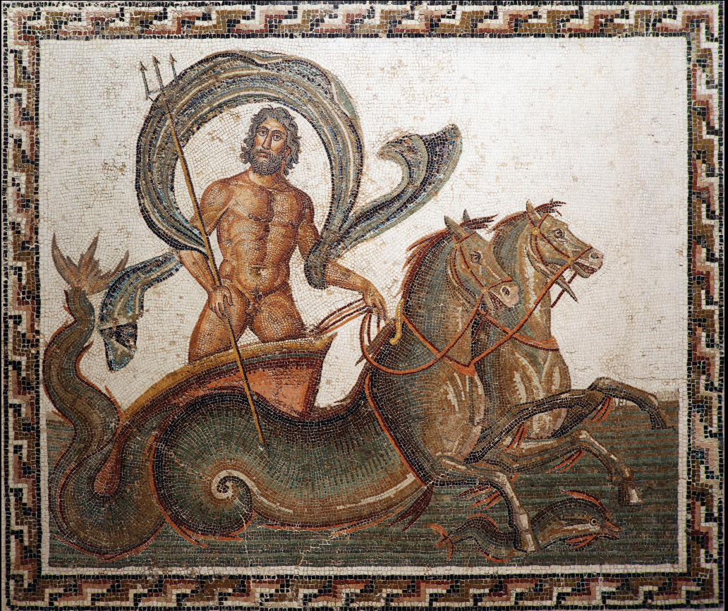
Мозаика III в. н. э., изображающая Нептуна, управляющего колесницей, запряженной морскими коньками. Археологический музей Суса, Тунис