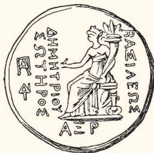
Богиня Тюхэ на греческой монете 187 г. до н. э. – 150 г. до н. э.

Так царит окруженный сонмом светлых богов на Олимпе великий царь людей и богов Зевс, охраняя порядок и правду во всем мире.