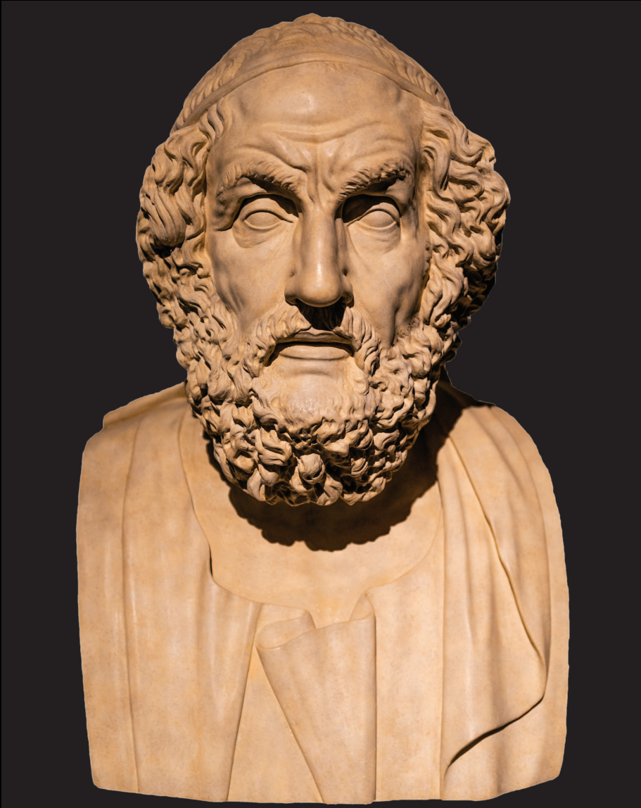
Гомер. Скульптура II в до н. э.