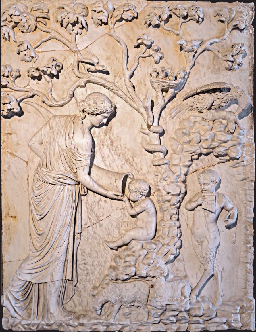
Адрастея кормит маленького Зевса из рога козы Амалфеи. Справа стоит бог Пан, играющий на свирели. Барельеф II в. до н. э.