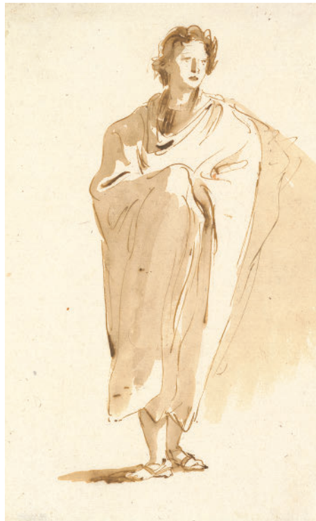
Джованни Баттиста Тьеполо. Стоящая фигура юноши. Ок. 1755–1760

В середине XIX века рисунок и графика окончательно выделились в самостоятельный вид искусства. Наброски пейзажей, портретов, фигур, интерьеров стали считаться полноценными произведениями, не предполагающими завершения или продолжения найденной темы в другой технике. Это привело к большому многообразию стилей, индивидуальных пластических и технических находок, интонаций. Стало не так важно, что именно нарисовано, важно — как. Благодаря этому в XX веке появилось множество художников, для которых натурный рисунок фигуры человека стал одной из основных тем творчества. Можно вспомнить Густава Климта, Эгона Шиле, Огюста Родена, Владимира Лебедева, Николая Тырсу, Бориса Григорьева, Ричарда Дибенкорна, Герхарда Маркса, Георга Кольбе, Дэвида Хокни, Дмитрия Кардовского и многих других.