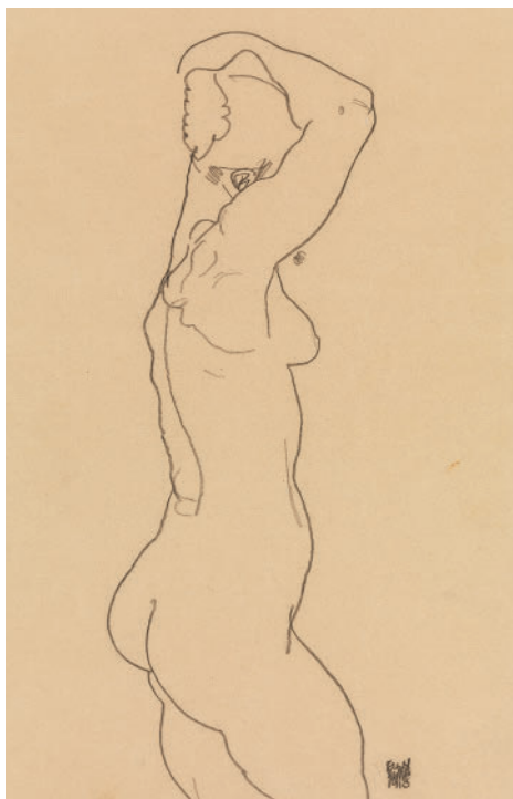
Эгон Шиле. Стоящая обнаженная, вид справа. 1918