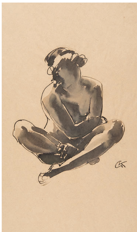
Георг Кольбе. Присевшая на корточки (набросок). 1913–1916

Другое дело — постановки, натура и место красоты в академической программе. С этим связаны сложные вопросы, из-за которых весьма эффективная система воспринимается сейчас многими как реликт. Но это тема для отдельного разговора.