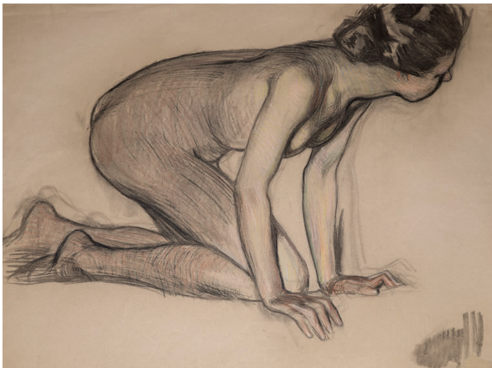
Дмитрий Кардовский. Натурщица. К картине «Самсон и Далила». 1902