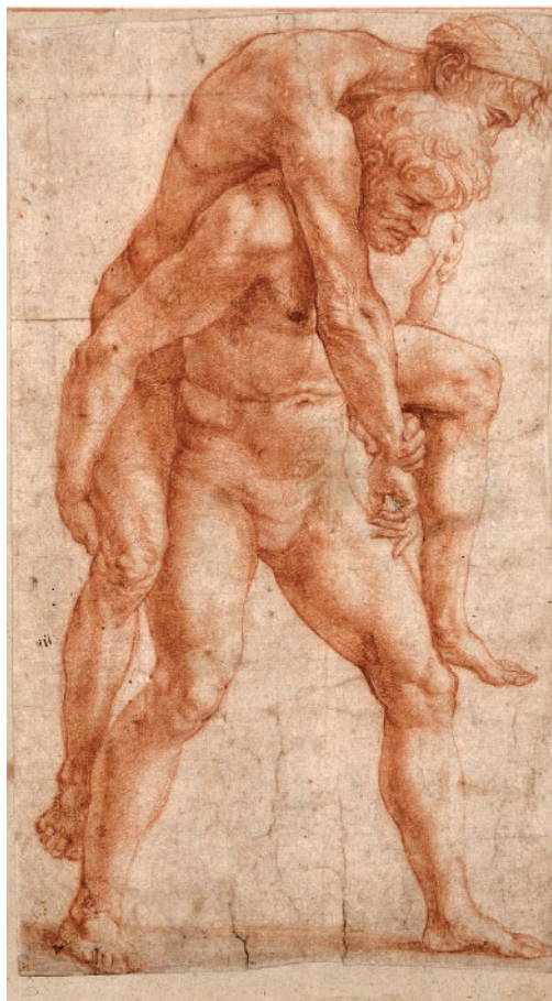
Рафаэль Санти. Молодой мужчина, несущий старика на спине. Этюд для фрески «Пожар в Борго». Ок. 1514