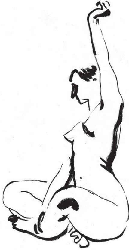
Дмитрий Горелышев. набросок фигуры. Брашпен с черной тушью