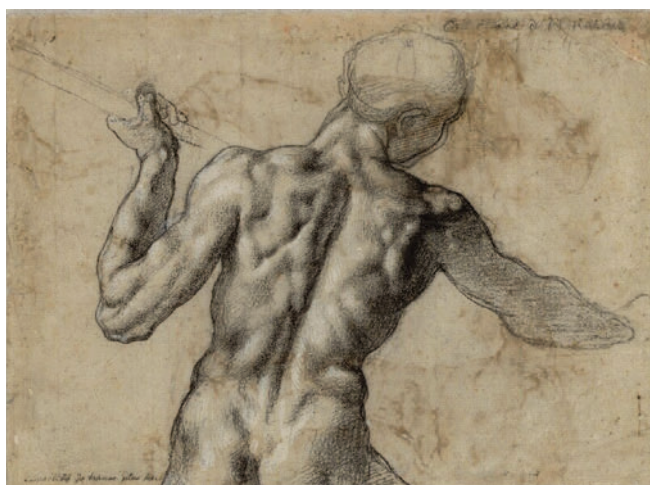
Микеланджело Буонарроти. Обнаженный мужчина со спины. Этюд солдата с копьем для фрески «Битва при Кашине». Ок. 1504