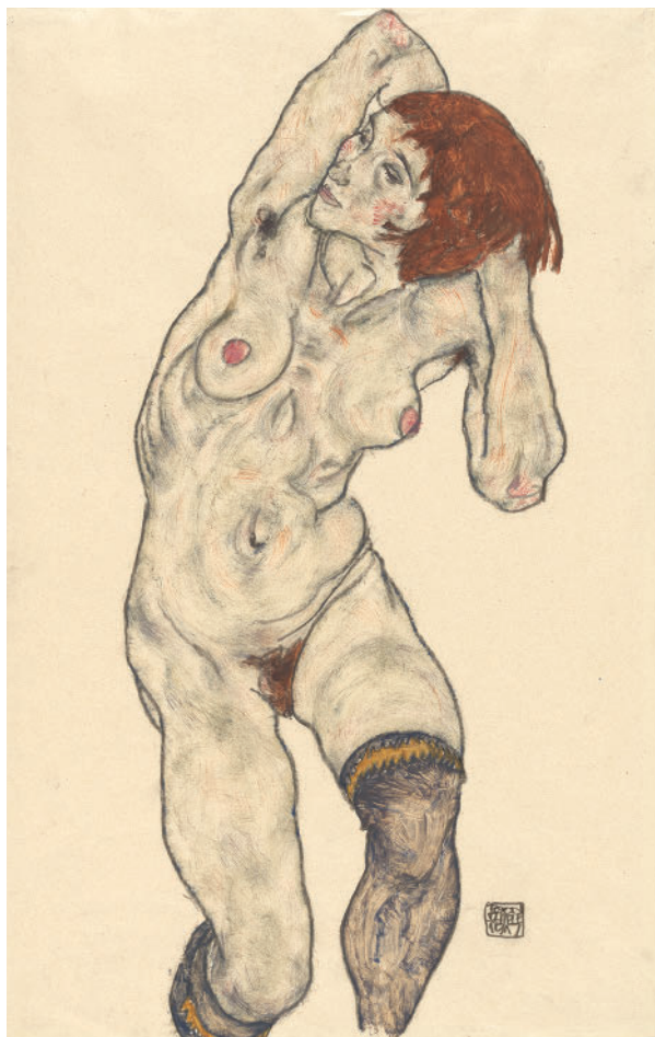
Эгон Шиле. Обнаженная в черных чулках. 1917

В наше время личная рисовальная практика стала распространенным явлением не только среди профессиональных художников. Например, в Простую школу приходят рисовать люди совершенно разных профессий, возраста, навыков. Для кого-то это что-то вроде рисовальной зарядки, поддержания уровня необходимых навыков, для кого-то — способ отдохнуть от работы, получить новые впечатления, побыть в художественной среде, для кого-то — просто необычный досуг.