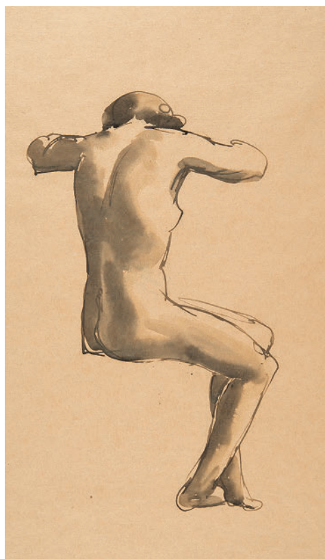
Георг Кольбе. Сидящая (набросок). 1913–1916