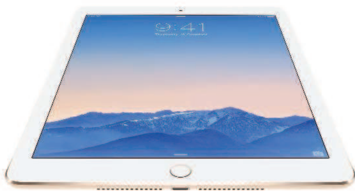
iPad Air 2

Первый iPad появился весной 2010 года и стал настолько популярным, что компания Apple с тех пор обновляла его шесть раз, делая экран четче, а процессор — быстрее и упрощая синхронизацию.