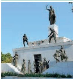
Никосия. Монумент Свободы