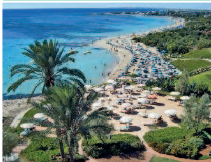
Остров Кипр — это живописный рай для курортников

Протяженность острова с севера на юг в самом широком месте составляет 96 км, с востока на запад — 224 км.