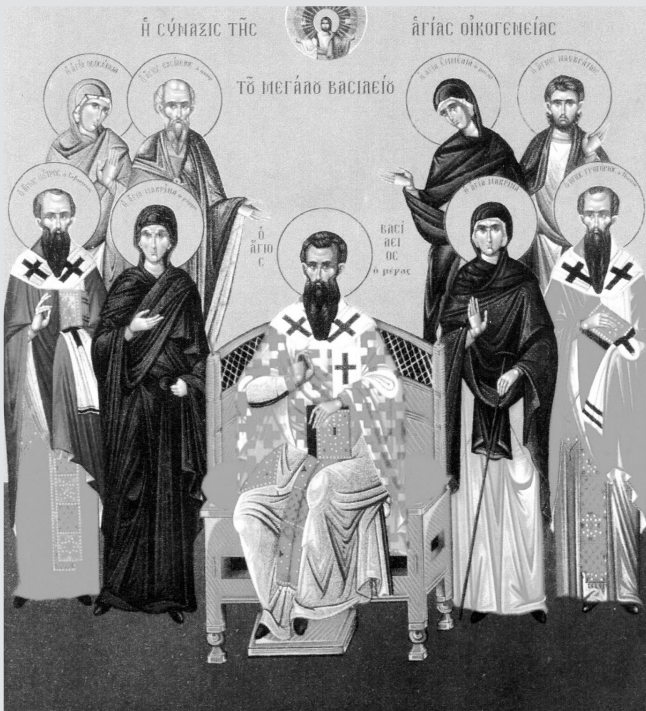
Святитель Василий Великий; его родители: святой Василий Старший и преподобная Эмелия; его братья святители Григорий Нисский и Петр Севастийский, праведный Навкратий; его сестры: преподобная Макрина и блаженная Феозва диаконисса

и Феодотия) — все прославлены в лике святых (в Константинопольской и Элладской Церквях).