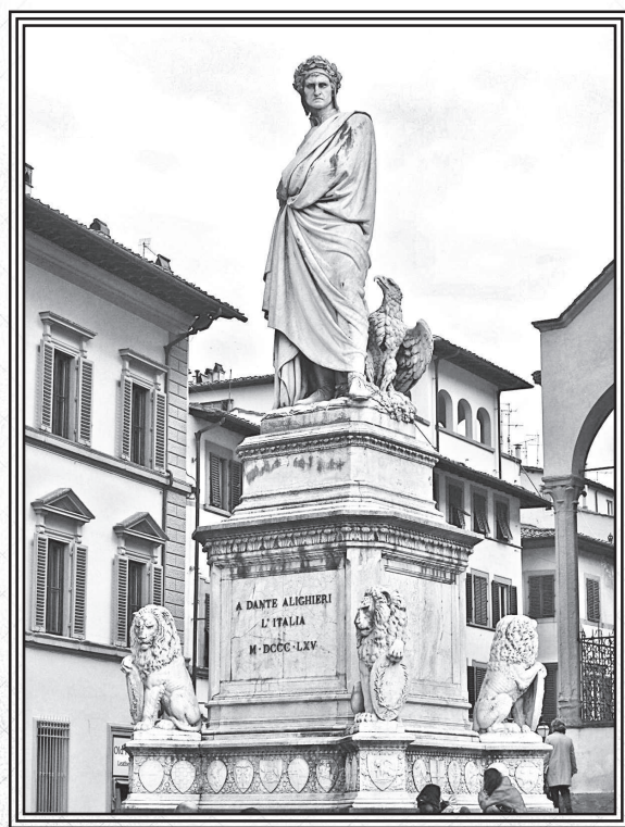
Памятник Данте во Флоренции на площади Санта Кроче

Работа над «Пиром» была оставлена в 1309 году, когда для гибеллинов и Данте казалось занялась заря новой жизни после избрания Генриха Люксембургско-