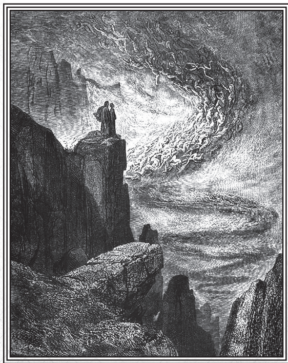
Подземный вихрь, бушующий на просторе, С толпою душ кружится в царстве мглы

лиц было вполне логично, так как без идеи посмертного воздаяния за грехи и за праведную жизнь на земле невозможно было обоснование христианской морали. Учение о чистилище появилось позднее и было плодом богословских умствований VI века, стремившихся смягчить мрачный пессимизм изначальной христианской догматики. Представление о чистилище основано на вере, что своевременное! покаяние может повести к прощению любого греха. Относительно местоположения чистилища твердых данных не существовало, в то время как считалось точно установленным, что ад находится где-то в подземных безднах, а рай обязательно в небесах. Поэтому пейзажи ада и рая Данте рисовал по канве, существовавшей издавна, а пейзажи чистилища — соз-