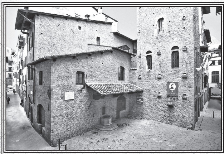
Дом-музей Данте во Флоренции

«Комедия» — последнее и самое зрелое произведение Данте. Поэт не сознавал конечно, что его устами в «Комедии» «заговорили десять немых столетий», что он подытоживает в своем произведении все развитие средневековой литературы.