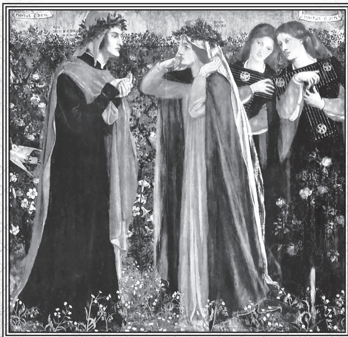
Данте Габриэль Россетти. Данте и Беатриче

ном некоторых городских советов, хотя и не обнаружил ни особенного интереса к политической жизни, ни особенного усердия в исполнении своих политических обязанностей. Но если Данте сам не искал политических лавров, то его нашли политические тернии. Положение во Флоренции осложнялось. «Ordinamenti» не могли положить конца политической борьбе. После поправок 1295 года власть в городе фактически стала принадлежать старшим цехам, т. е. промышленной, торговой и финансовой буржуазии. Младшие, ремесленные цехи, правившие два предшествующих года, были оттеснены, а в группе старших видную роль стали играть дворяне: разрешение записываться в цехи снова открыло им путь к власти. Коалиция дворян с крупной торговой, банковской и промышленной буржуазией сделалась основой