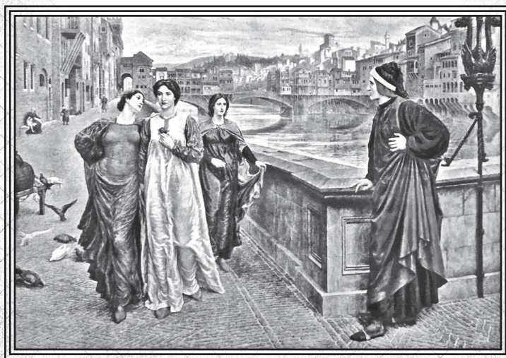
Генри Холлидей. Данте и Беатриче

Данте Алигиери (Dante, сокр. из Durante Alighieri, 1265–1321) — величайший итальянский поэт. Родом из Флоренции, принадлежал к городской знати среднего достатка; предком его был рыцарь Каччагвида, погибший во втором крестовом походе в 1147 году. По имени жены его Алагиеры был назван один из сыновей. Потомство Алагиеро стало зваться Алагиери или Алигиери. Отец Данте, по-видимому, был юристом. В семье еще жили феодальные настроения, хотя долгое пребывание в стенах большого торгового города заставляло эти традиции тускнеть. Школа дала Данте начатки знаний в рамках средневековых школьных программ, т. е. очень мало. Университета во Флоренции еще не было. Закладывать настоящие основы своих знаний Данте приходилось самому. Он читал все, что попадало под