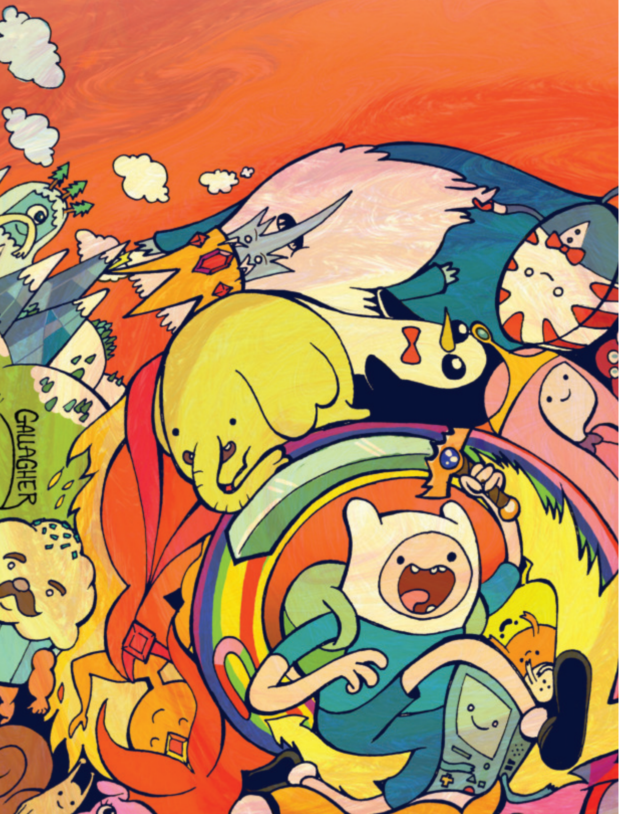
Рисунок: Джон Галлахер