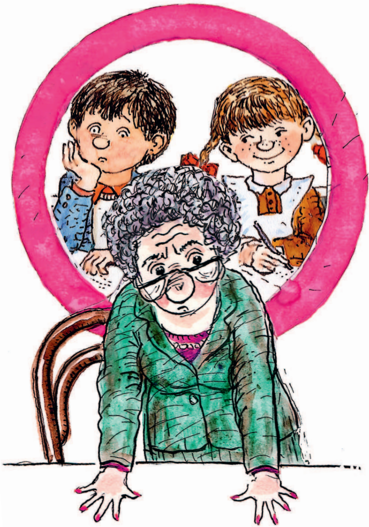
Рисунки Н. Беланова