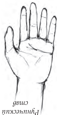
Рисунок №2 – Рунический став на запястье

Если Ваша рука опущена вниз, став сохраняет прямое, рабочее положение. Иначе получите откат и проблемы.