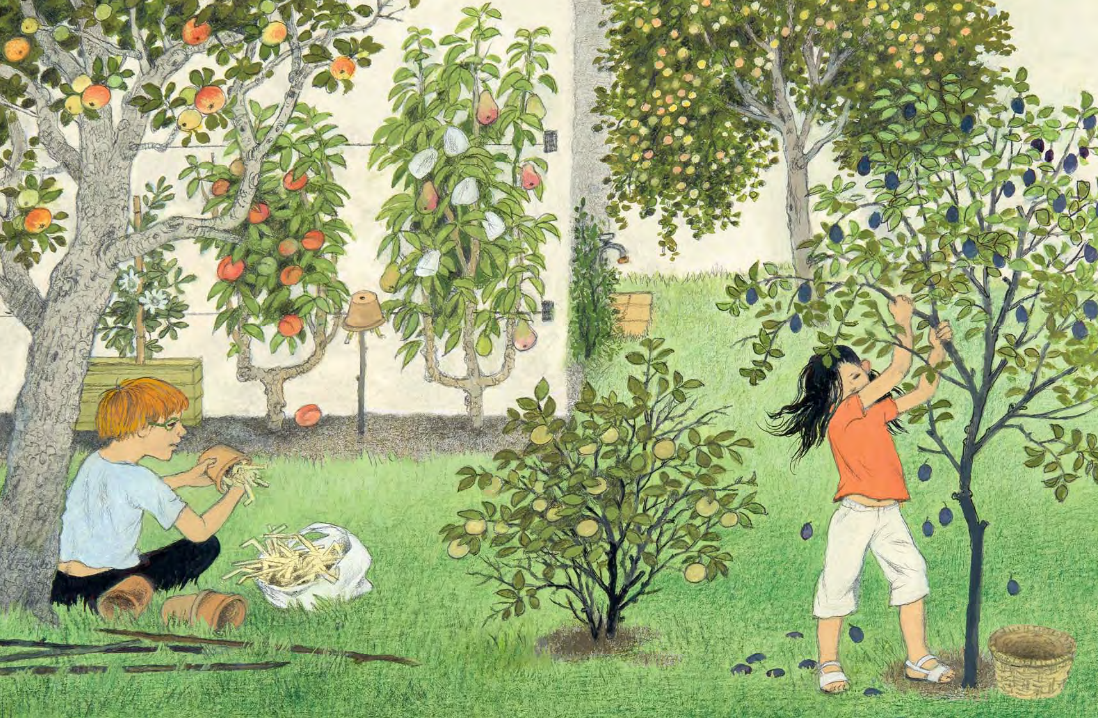
яблоко сорта «Ренет»; персик; груша сорта «Вильямс»; сливы «Ренклюд», «Мирабель» и «Стенлей»