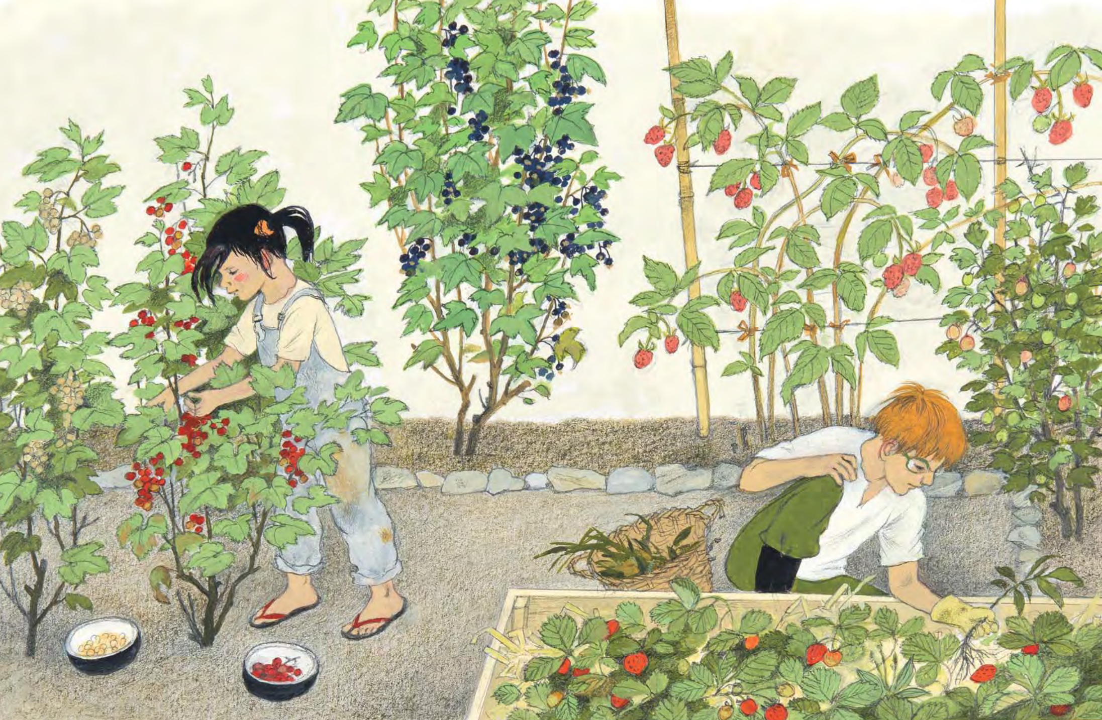
красная и белая смородина