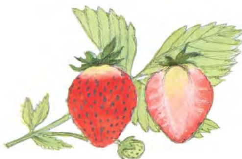
Ягоды клубники, целая и разрезанная