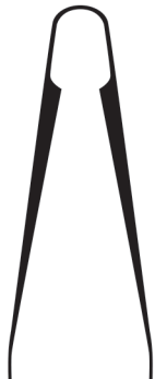
щипчики для кондитерских изделий