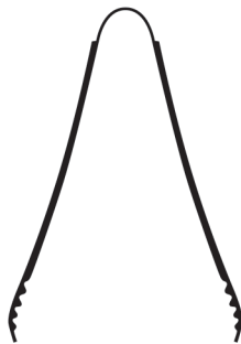
щипчики для льда