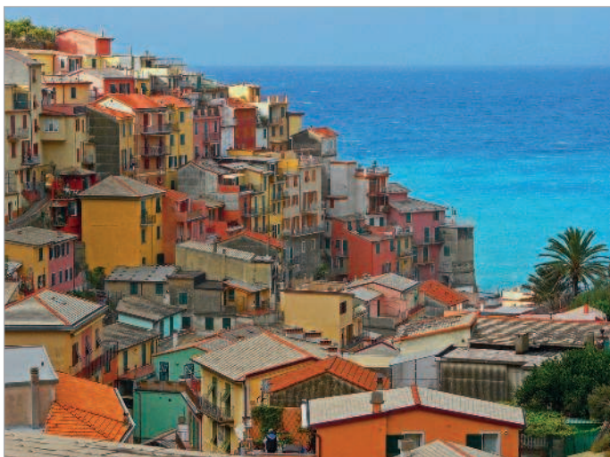
■ Итальянский вид

хвалиться. Потому-то невозможно удивляться, что и сейчас Италия продолжает задавать моду в области дизайна и производства — с такой-то наследственностью!