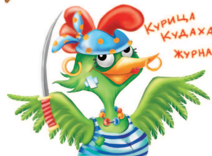
Курица Кудаха Журналист