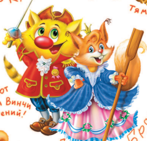
Кот да Винчи гений!