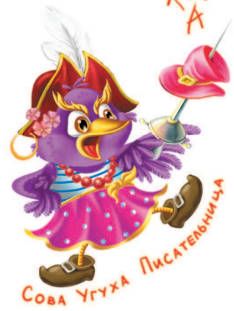
Сова Угуха Писательница