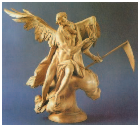
Ф. Гюнтер. Кронос. 1765—1770 гг. Баварский национальный музей, Мюнхен

Химéра (чудовище с головой и шеей львицы, туловищем дикой козы и хвостом дракона), а также Сфинкс — странное существо с женской головой, львиным телом и птичьими крыльями. Именно Сфинкс задавал людям загадку: «Кто из живых существ утром ходит на четырёх ногах, днём на двух, а вечером на трёх»? Всем, кто не мог отгадать её, грозила смерть.