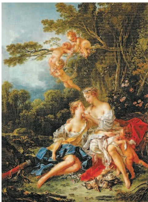
Ф. Буше. Юпитер и Каллисто. 1744 г. Государственный музей изобразительных искусств им. А. С. Пушкина, Москва

Выберите ясный погожий вечер и взгляните в звёздное небо. Не правда ли, оно завораживает нас своей красотой и безмолвным величием? А ведь вид звёздного неба не изменился, мы видим его таким, каким он открывался взору людей, живших тысячи лет назад. Вот, например, что рассказали нам древние греки о созвездиях Большой и Малой Медведицы, кото-