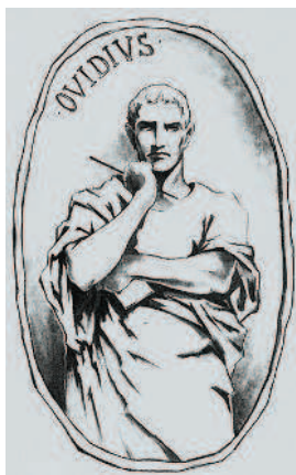
Обложка книги Овидия «Метаморфозы»

12 тысячах стихов. Равной ей нет во всей античной литературе, а поэтому в дальнейшем на страницах нашего учебника большинство примеров будет взято именно из неё. Следует также назвать «Энеиду» Вергилия, труды историка Геродота и археолога Павсания. В большинстве названных произведений созданы яркие картины, увлекательные описания, живо и легко запоминающиеся образы и сюжеты.