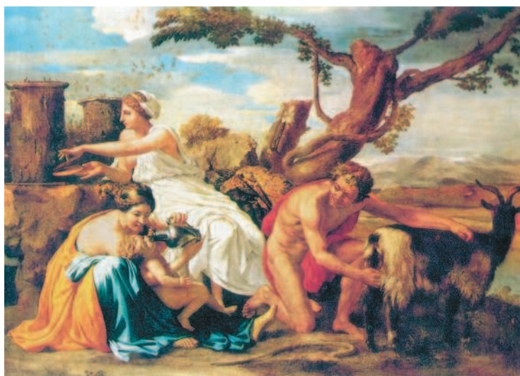
Н. Пуссен. Детство Юпитера. 1637 г. Картинная галерея колледжа, Далли

дан на воспитание лесным божествам на остров Крит. Французский художник Никола Пуссен (1594—1665) запечатлел этот сюжет в картине « Детство Юпитера ». Персонажи картины свободно располагаются среди живописных деревьев и скал. Одна из нимф лёгким движением, напоминающим танец, собирает мёд из древесного дупла. Согласно легенде, младенец Зевс был вскормлен козой Амалфеей. После смерти своей кормилицы Зевс в знак признательности вознёс её на небо, превратив в созвездие Возничего. Шкуру козы он превратил в щит (эгиду) — знак высшей божественной власти, а рог Амалфеи — в рог изобилия, обладавший волшебным свойством давать всё, что пожелает его обладатель.