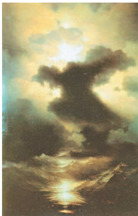
И. Айвазовский. Хаос (Сотворение мира). 1841 г. Музей армянской культуры, Венеция

4. Подумайте, какое значение и почему имеют в нашем языке такие слова и словосочетания, как ехидна , цербер , химера , сфинкс , провалиться в тартарары , рог изобилия , находиться под эгидой . Составьте собственный словарь устойчивых словосочетаний (фразеологизмов).