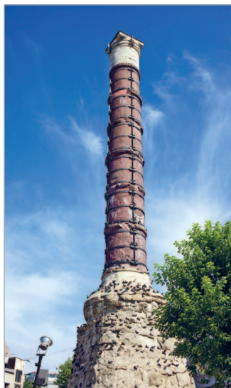
■ Римская триумфальная колонна на площади Чемберлитайш