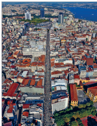
■ Вид с высоты на улицу Истикляль