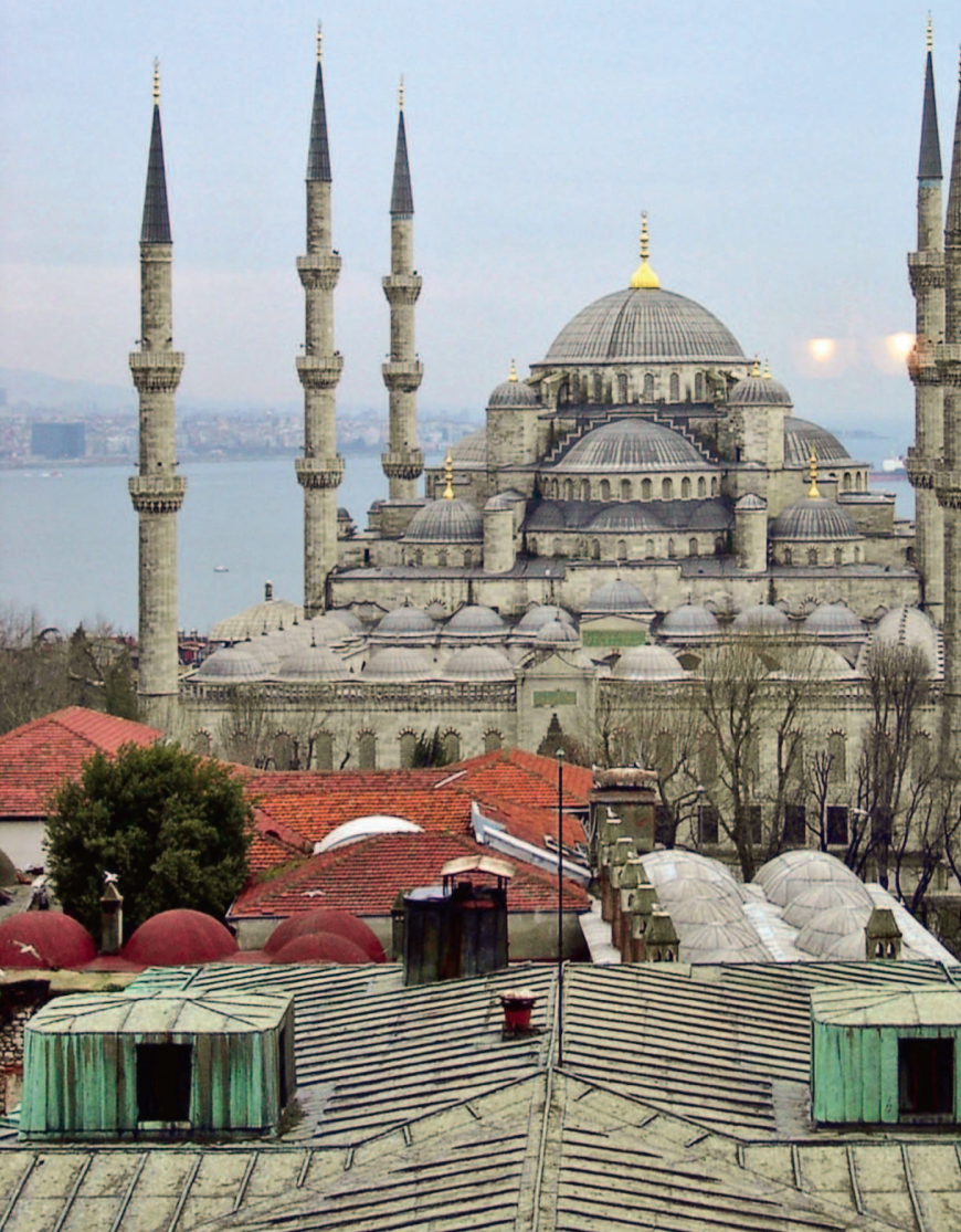
■ Голубая мечеть Султанахмет