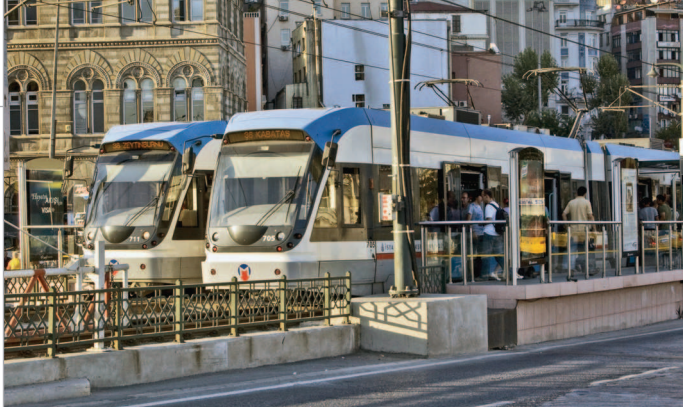
■ Скоростной трамвай

По убеждению нобелевского лауреата – писателя Орхана Памука 1 , Стамбул – очень меланхолический город, грусть – это главное чувство, которое он рождает.