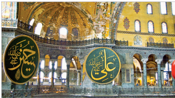
■ В мечети Айя-София

похожей на гигантскую жабу). Я с этим не согласен, но образ говорит сам за себя, он оправдан, что называется, технологически – снаружи много всего «распластанного», – и все для того, чтобы выдержать огромную тяжесть каменного «небесного свода».