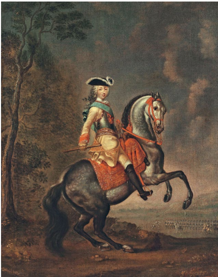
Ил. 49 Великий князь Петр Федорович на коне Худ. Г.-К. Гроот Ок. 1742 г.