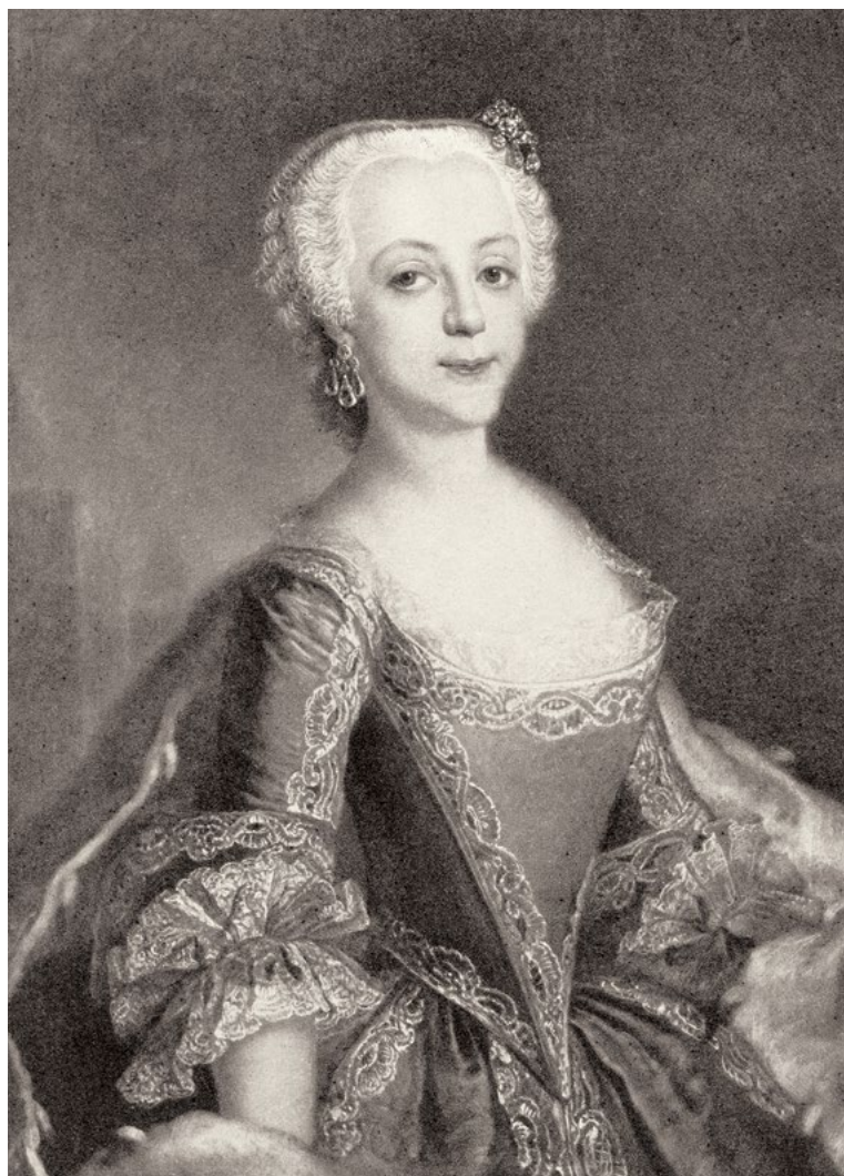
Ил. 1 София Фредерика Августа Ангальт-Цербстская Худ. А.-Р. Лисневская Ок. 1740 г.