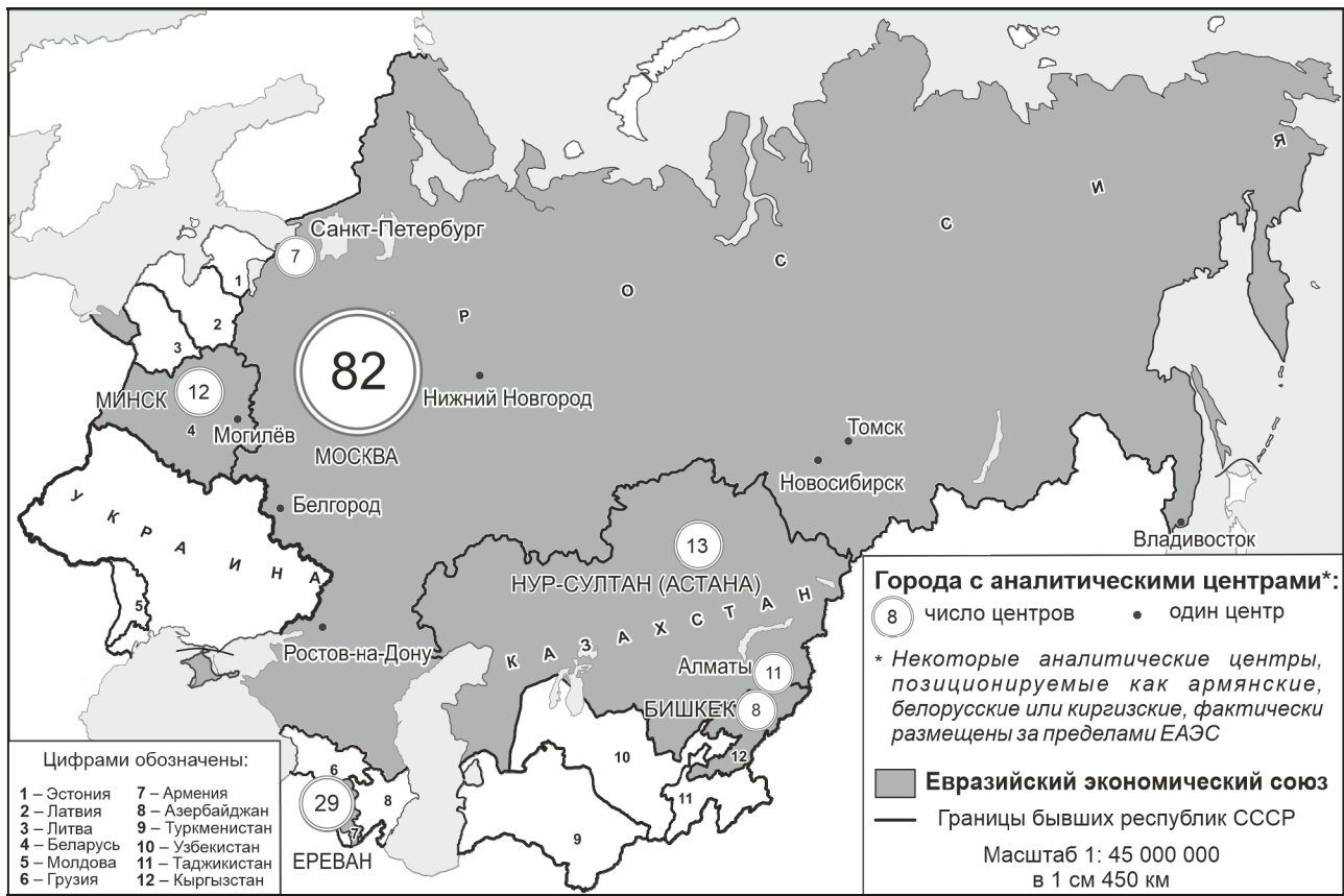
Карта 1. Аналитические центры ЕАЭС