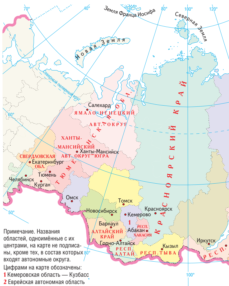
Примечание. Названия областей, одноимённые с их центрами, на карте не подписаны, кроме тех, в состав которых входят автономные округа. Цифрами на карте обозначены: 1 Кемеровская область — Кузбасс 2 Еврейская автономная область

Щит герба дополняют украшения , например, корона — символ власти. Императорская корона изображалась на гербах губерний и столиц и сохранилась на гербах Нижегородской, Псковской, Владимирской, Самарской, Тульской, Ярославской областей и Хабаровского края. Царская шапка Мономаха изображалась на гербах древних городов и сохранилась на гербе Тверской об-