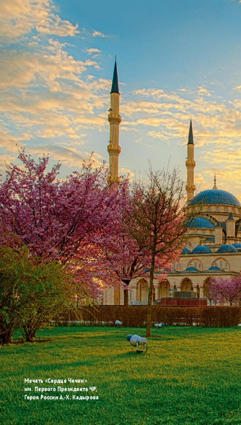
Мечеть «Сердце Чечни» им. Первого Президента ЧР Героя России А.-Х. Кадырова