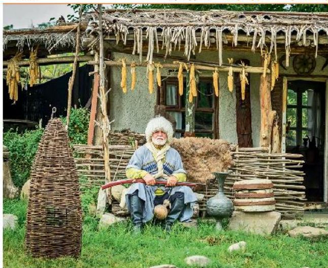
Краеведческий музей «Донди-Юрт»

столица Аланского государства город Магас. В период расцвета в нем проживали не менее 15 тыс. чел. Аланы и их столица пали под натиском монголов в XIII в., причем из хроник известно, что осада Магаса длилась очень долго.