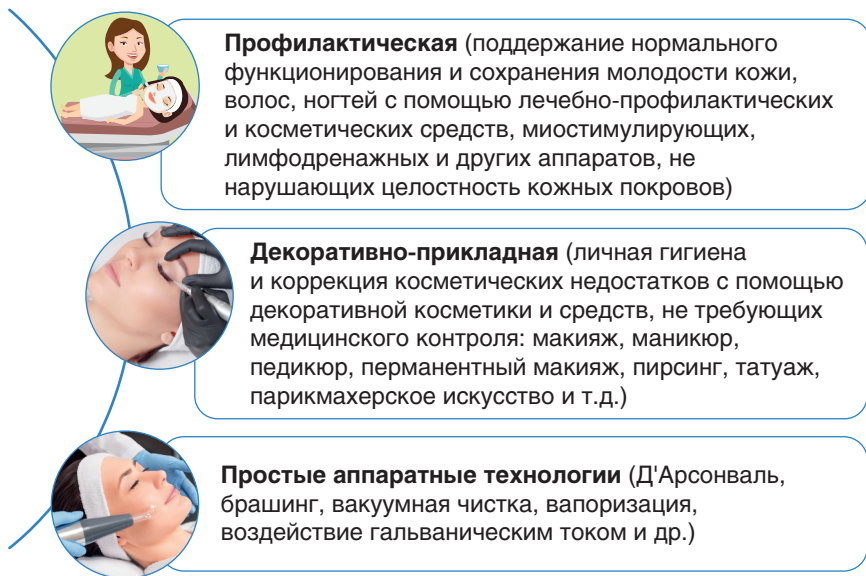
Рис. 1.3. Эстетическая косметология

Не допускается лечение кожных заболеваний, проведение лечебно-профилактических косметологических процедур, процедур с нарушением целостности кожного покрова. Эстетическую косметологию делят на профилактическую, декоративно-прикладную и простые аппаратные технологии (рис. 1.3).