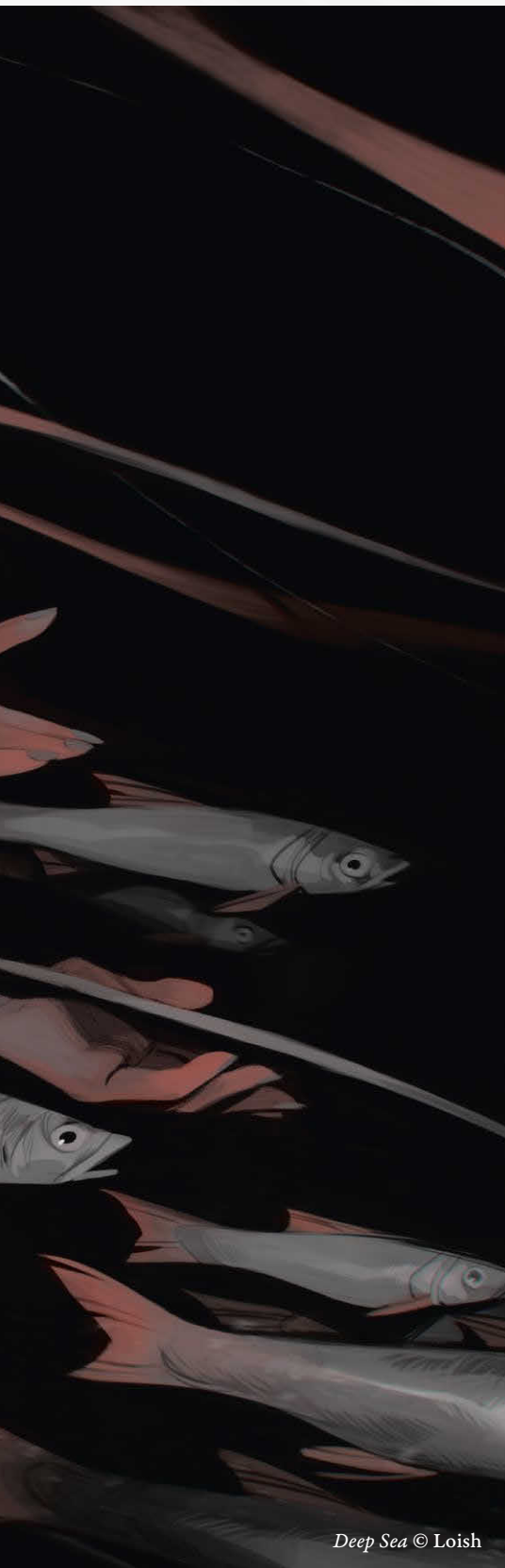
Deep Sea © Loish

Когда я впервые увидела творчество Элизы, то была очень впечатлена его оригинальностью и изысканностью. Ее наброски и картины не только отражали ее безграничный талант и мастерство, но и были поэтичны и выразительны. Я буквально оцепенела. Это те произведения искусства, которые тем интереснее, чем дольше вы их разглядываете. Новые детали раскрываются по мере того, как глаза следуют за движением линий и цветов. Я тоже художник, и первый вопрос, который я себе задала, был: «Как?»