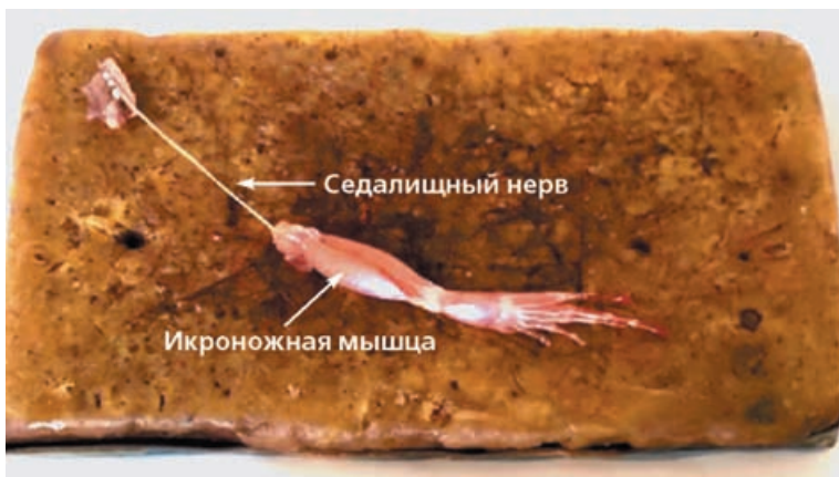
Рис. 1. Препарат из задней лапки лягушки

Впервые опыт, который неопровержимо доказывает существование электричества в живых тканях, проведен итальянским врачом Луиджи Гальвани в конце XVIII в. Для проведения этого опыта из задней лапки лягушки готовят препарат, состоящий из икроножной мышцы, седалищного нерва и части позвоночника (рис. 1). На икроножной мышце делают надрез (рис. 2) и набрасывают на нее дистальный отрез седалищного нерва,