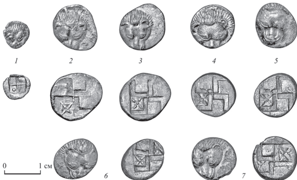
Рис. 2. Некрополь поселения Волна 1. Погр. № 168. Серебряные монеты Пантикапея 475–450 гг. до н. э.

№. 96–181). Гемиоболы поздней группы представлены и вкладах раннего боспорского серебра из Тирамбы 1946 г. ( Abramzon, Frolova, 2004. P. 27–48 ), Нимфея 1949 г. ( Голенко, 1974. С. 68–70 ), Патрея 1998 г. ( Абрамов, Болдырев, 2001. С. 143–144 ). Чеканку таких гемиоболов иногда без всякой аргументации приписывают храму Аполлона в Пантикапее ( Анохин, 2011. № 1135 ) и даже Гермонассе, будто бы чеканившей их для Аполлонийского монетного союза Боспора ( Мельников, 2009. С. 186, 209. № 62–73 ). Несмотря на попытку разделить эти монеты в связи с большой разницей в весе на гемиоболы, тетартемории и гемитетартемории ( Frolova, 2004. S. 20–21 ), очевидно следует считать, учитывая их однотипность, что все они принадлежат к одному номиналу и являются гемиоболами ( Голенко, 1974. С. 69 ). Предлагаются различные датировки, в том числе 470–460 гг. до н. э. ( Анохин, 1986. С. 136. № 17 ), 475–450 гг. ( Frolova, 2004. S. 20 ), конец 480-х – конец первой четверти V в. до н. э. ( Терещенко, 2009. С. 48 ), и т. д.