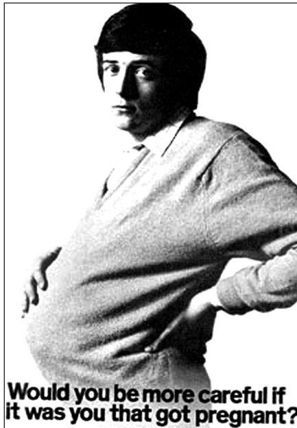
Рис. 50. (Текст на плакате: «Был бы ты более осторожным, если бы беременным был ты?»)»

В последние годы появилась т. н. инфографика. Как оказалось, в умелых руках она может неплохо работать на продажу (рис. 51).