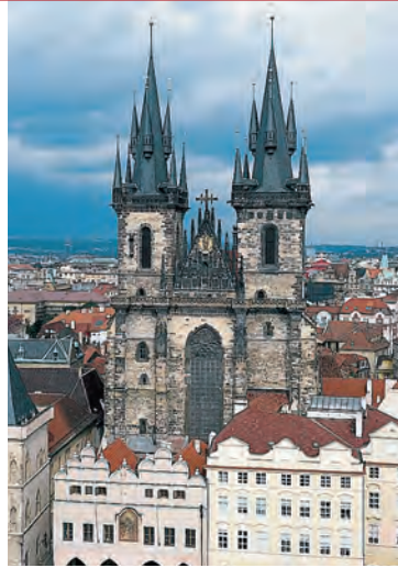
Башни Тынского храма

Прага, как и большинство столиц, имеет печальный опыт строительства современных зданий в окружении старинных исторических построек. Прежде всего здесь следует назвать здание «Новой сце-