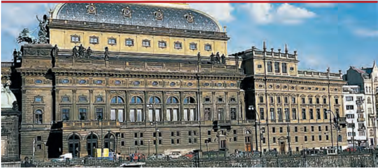
Гордость Праги – Национальный театр

XVI вв. — эпохе расцвета гуситского движения. Здесь прежде всего следует назвать имя самочинного проповедника Петра Хельчицкого и его труд «Сеть истинной веры».