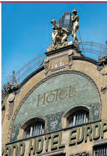
Гранд-отель «Европа» на Вацлавской площади в Праге — прекрасный образец чешского модерна

i Ассоциация отелей Чешской Республики: Revoluční 13, 110 00 Praha 1,