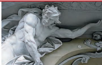
Фасад здания в Марианске-Лазне

Двадцатитрехлетнего Петра Парлержа (1330—1399) Император Карл IV вызвал из баварского городка Гмюнде. Зодчий вместе со своими