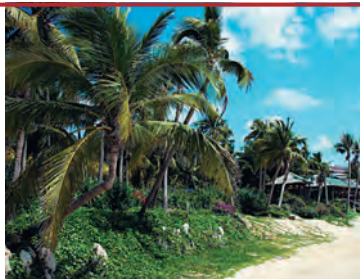
Зима на пляжах Хайнаня

На Хайнане преобладает морской тропический муссонный климат. Это означает ветреные, но теплые дни в течение всего года, хорошо различимые сухой и влажный сезоны, умеренные дожди и редкие тропические штормы. Не знающий холода в привычном нам смысле, остров Хайнань радует своих обитателей средней годовой температурой около +25 °С. Среднегодовое количество осадков – 1600 мм. Ежемесячно выпадает 130–140 мм. Влажные центральные части и восточное побережье Хайнаня получают больше осадков (до 200 мм ежемесячно), чем более засушливое юго-западное побережье (менее 75 мм ежемесячно). Относительная влажность воздуха – 75–85%, во