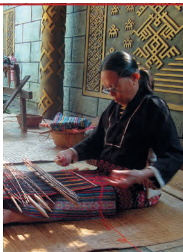
Ткачиха народности ли

что в XII—XIII вв. посланцы императорского двора специально приезжали на Хайнань перенимать опыт изготовления и крашения тканей. Для тканей и одежды ли характерны богатая вышивка и красочный своеобразный орнамент женских мини-юбок.