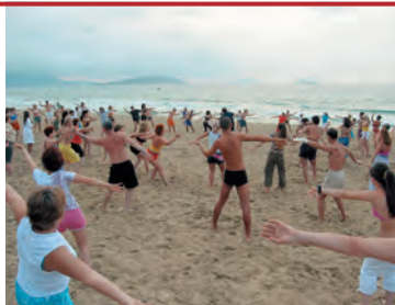
Раннее утро. Занятия тайцзицюань на пляже

В 1982 г. население Хайнаня составляло 3,7 млн человек и менее чем