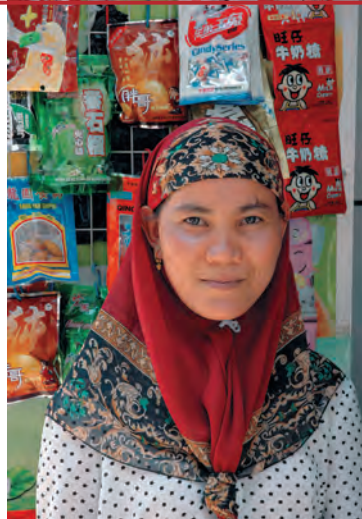
Женщина народности хуэй

Рождаемость существенно снизилась и составляла в 2000 г. 15,7 на тысячу жителей. Если в 1981 г. каждая хайнаньская женщина рожала за свою жизнь более 4 детей, то в 1990-е гг. — уже менее 3. Смертность сейчас находится на довольно низком уровне (5,8 на тысячу), а до образования КНР она была в пять раз выше. Средняя продолжительность жизни, составлявшая тогда около 40 лет, достигла теперь 67 лет для мужчин и 73 лет для женщин и продолжает расти. Хайнань благодаря своему климату и здоровому образу жизни местных жителей прославился в Китае как район, где проживает наибольшее количество