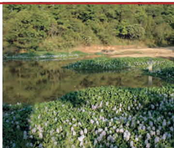
Водный гиацинт на горном озере

Образованию острова предшествовала интенсивная деятельность вулкана, находившегося в северной части полуострова Лэйчжоу. При извержениях изливалась преимущественно базальтовая лава, покрывшая большую часть полуострова и северную прибреж-