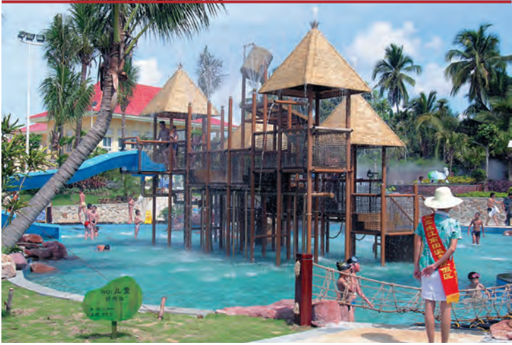
Термальные источники Pearl River Nantian Hot Spring

■ Conrad Sanya Haitang Bay , Hainan, Sanya, Haitang Bay, Haitang Road, http://conradhotels3.hilton.com . 🍷🍷🍷