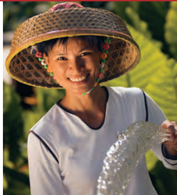
На Хайнане вам будут рады

Если однажды январской ночью вам приснится сон, в котором вы спускаетесь с горной вершины, открытой теплым южным ветрам, пробираетесь через тропический лес, перевитый лианами и орхидеями, затем под звон цикад вступаете на равнину, поросшую пальмами и садами с диковинными тропическими плодами, и, пройдя по чистейшему белому песку, погружаетесь в ласковые волны кораллового моря, знайте: ваш сон существует в реальности — это остров Хайнань!