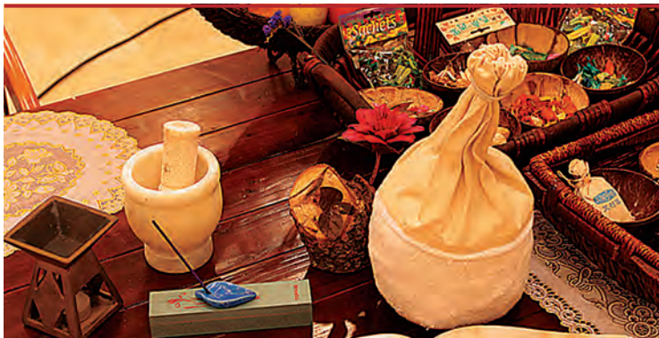
Императорский мешочек для массажа стоп

чательный диагноз может звучать, например, так: «избыток энергии ян печени», и лечение будет направлено на устранение этого избытка.