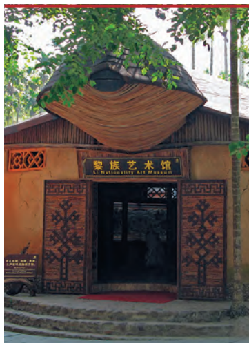
Выставка искусств и ремесел