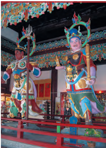
В буддистском храме. Стражи сторон света

между рождениями. В последние годы это условие по рекомендации Комитета ООН по народонаселению отменено. Двумя детьми ограничивают и рождаемость у наименьшинств, но им позволяют иметь третьего ребенка, если первые два девочки. В результате политики однодетной семьи доля рождений третьего и последующих детей на Хайнане упала с 45% в 1981 г. до 12% в 2000 г.