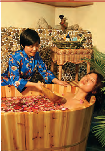
Для лечебных ванн применяют ароматические травы

Так, например, почки соответствуют первоэлементу « Вода » и не только отвечают за функции мочеполовой системы, но и хранят энергию, отвечая также за кости; воротами почек являются уши. Таким образом, проявлением недостатка энергии почек может быть боль в пояснице и суставах, шум в ушах. Недостаток энергии первоэлемента « Вода », которому соответствует функциональная система « Почки », может быть связан с недостаточным питанием первоэлемента « Дерево », которому соответствует функциональная система « Печень », или же с недостаточным сдерживанием первоэлемента « Огонь », которому соот-