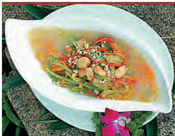
Ароматным супом заканчивается обед по-китайски