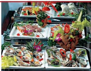
«Морская свежесть» в ресторане Хайнаня

Вэньчанский цыпленок — отварное, нежнейшее мясо цыпленка. Подается порезанным на кусочки с набором приправ из перца, арахиса, зелени, лайма, которые предполагается смешать и в полученный соус макать кусочки мяса. Цыплят