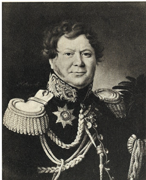
Николай Николаевич Муравьев — отец М. Н. Муравьева