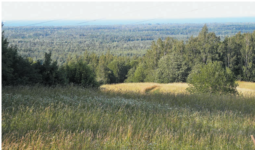
Вид на урочище Сойкино и Финский залив. Здесь «у самого моря» были испомещены Муравьевы по прибытии на Новгородские земли в конце XV столетия. Ныне это территория сельского поселения Вистино Кингисеппского района Ленинградской области. Фото 2019