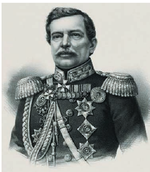
Николай Николаевич Муравьев (Карский) — брат М. Н. Муравьева