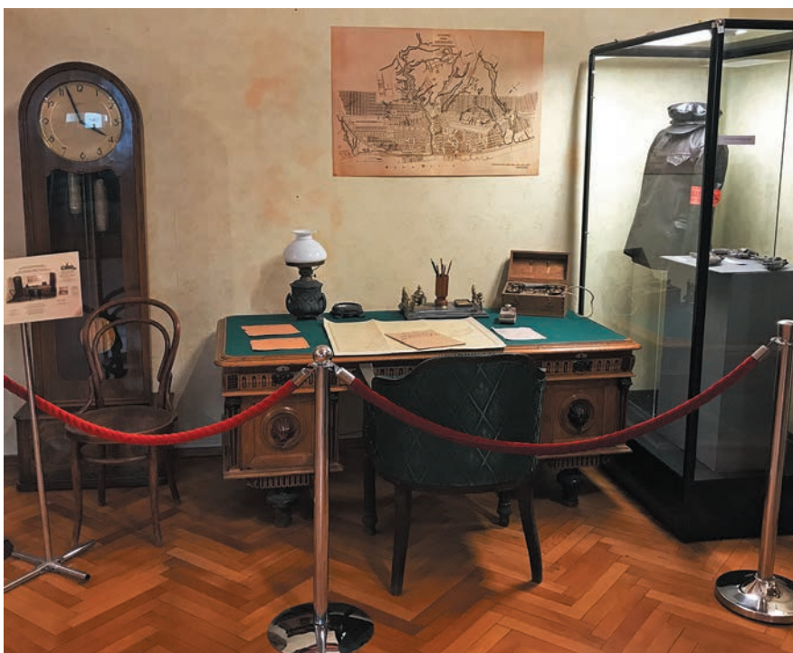
Рабочий кабинет штаба обороны Царицына. Реконструкция. Музей-заповедник «Сталинградская битва».