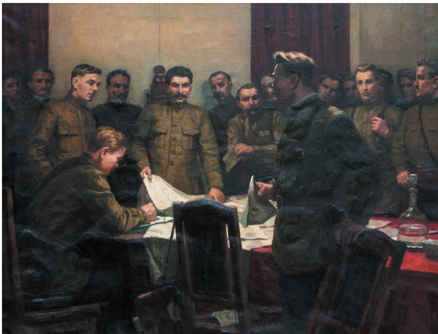
Невежин Ф. И. Сталин проводит совещание с комсоставом Царицынского фронта. 1954 г. Музей-заповедник «Сталинградская битва»