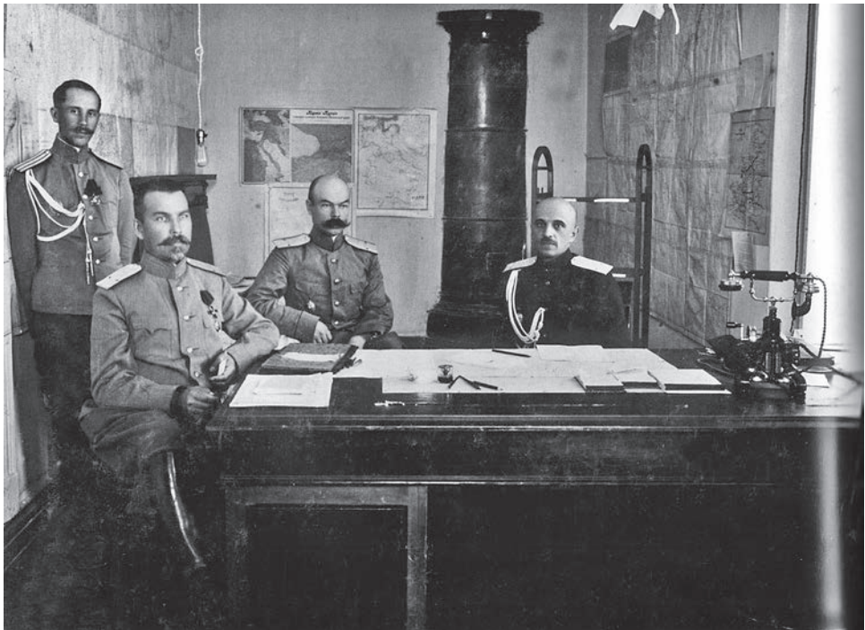
Штаб Донской армии.