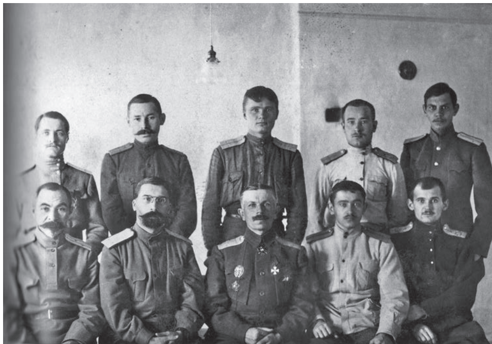
Оперативная часть штаба Северного фронта Донской армии. В центре сидят генерал-майоры В. А. Замбрицкий и М. М. Иванов. 1918 г.