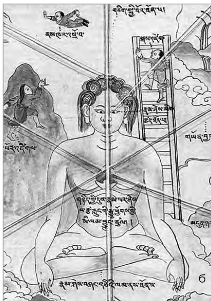
Рис. 1.1. Сновиденческие лестницы в небо:

а – райская лестница (византийская икона XII века, монастырь Святой Екатерины); б – лестница Будды (фрагмент бурятской тханки XIX века, «Атлас тибетской медицины»).