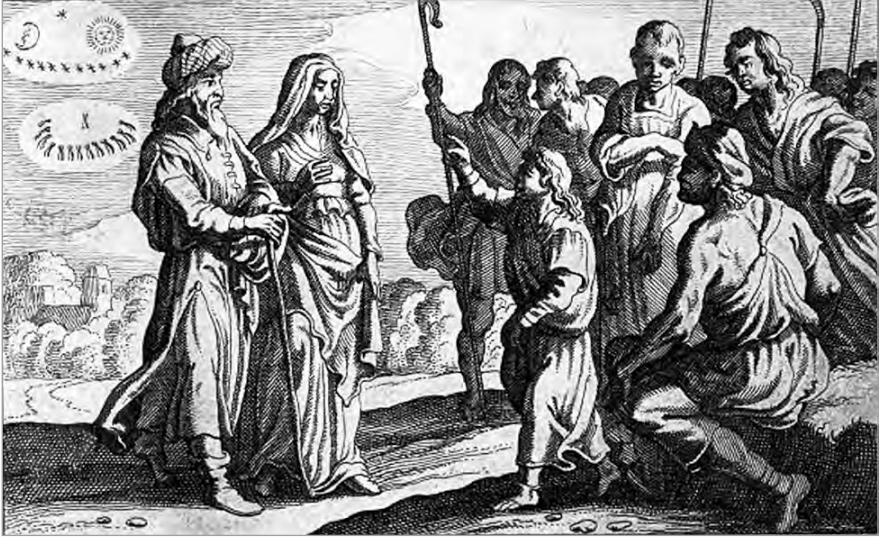
Рис. 1.2. Иосиф рассказывает о своем сне. Питер Схют. «Библейская история», 1659 г.

И сказали ему братья его: неужели ты будешь царствовать над нами? Неужели будешь владеть нами? И возненавидели его еще более за сны его и за слова его.