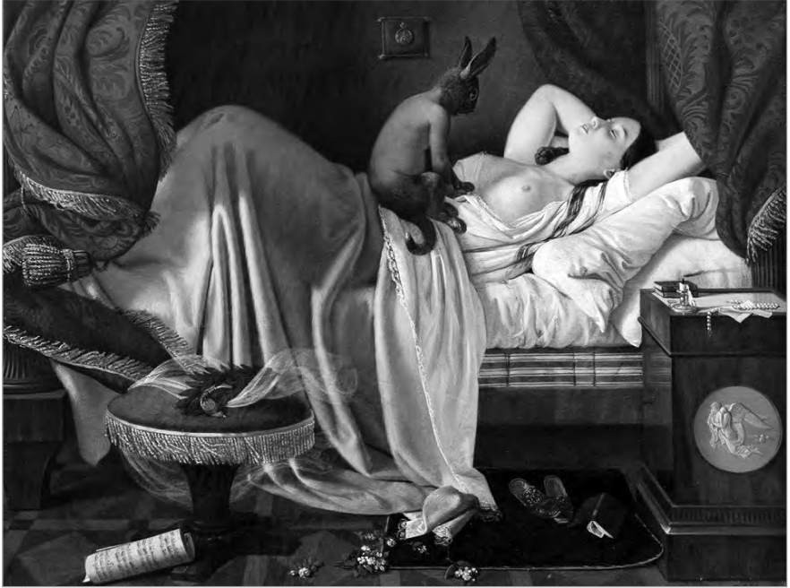
Рис. 1.3. Ditlev Blunck. Ночной кошмар. 1848 г.

в том числе голосовая складка, но состояние сна либо еще не наступило, либо уже закончилось. Как правило, это происходит при положении тела на спине или животе; спящий думает, что проснулся, но при этом не владеет своими членами, находится в темном и сумеречном, но знакомом пространстве. Довольно часто он ощущает, как будто нечто садиться на него верхом или охватывает ногами, начинает давить или душить, но не может ничего поделать, даже если рядом с ним на постели находится близкий ему человек, спящий беспробудным сном (рис. 1.3). Он ощущает необычайное одиночество в своем положении, но через некоторое время выходит из этого состояния с чувством глубокого страха, иногда – отвращения к напавшим на него существам, весь покрытый потом. Состояние сонного паралича известно практически всем людям. С регулярностью оно может сопровождать