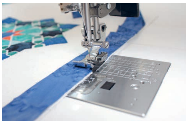
Лапка для пэчворка с ограничительной боковой пластиной