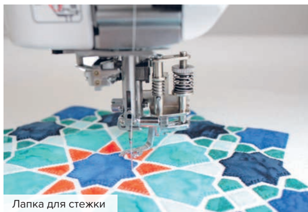
Лапка для стежки