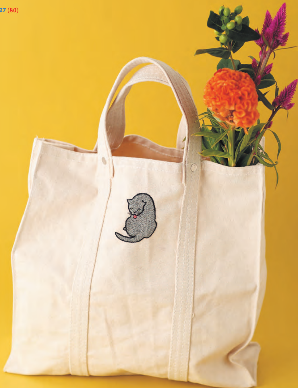
Фото на с. 27 (80)

Любой выход на прогулку станет еще веселее, если у вас есть шопер с озорным котенком.