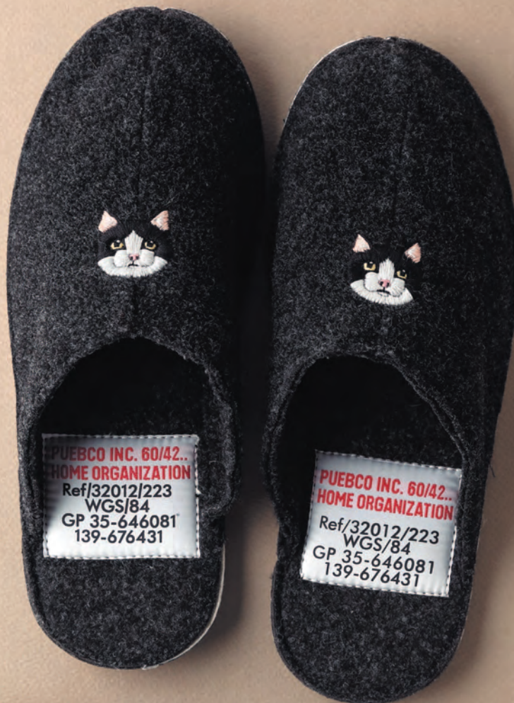
Фото на с. 24 (48)

Домашние тапочки с кошечками согреют вас в самый холодный зимний день.