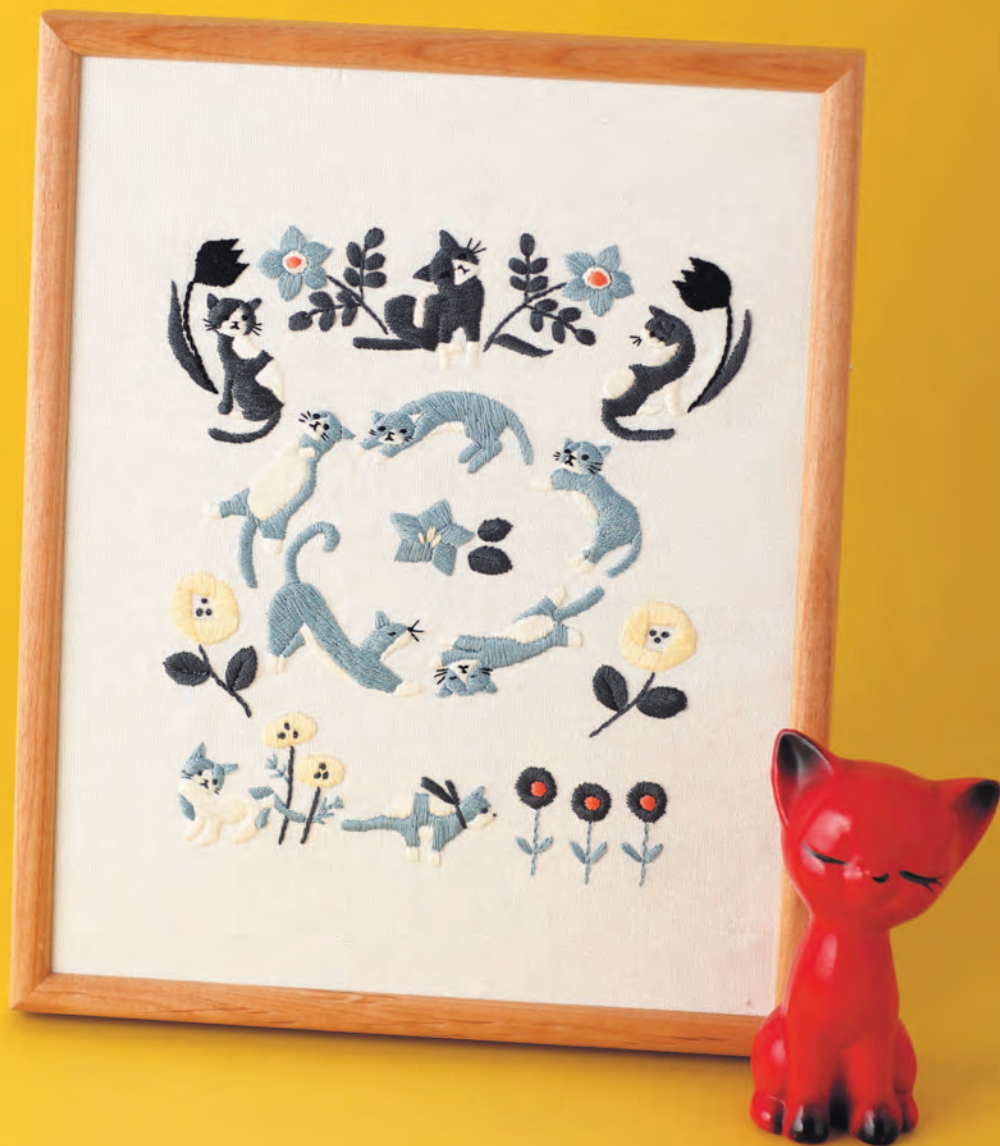
Фото на с. 32 (122–137)

Вышивка в рамочке — отличное дополнение к интерьеру.