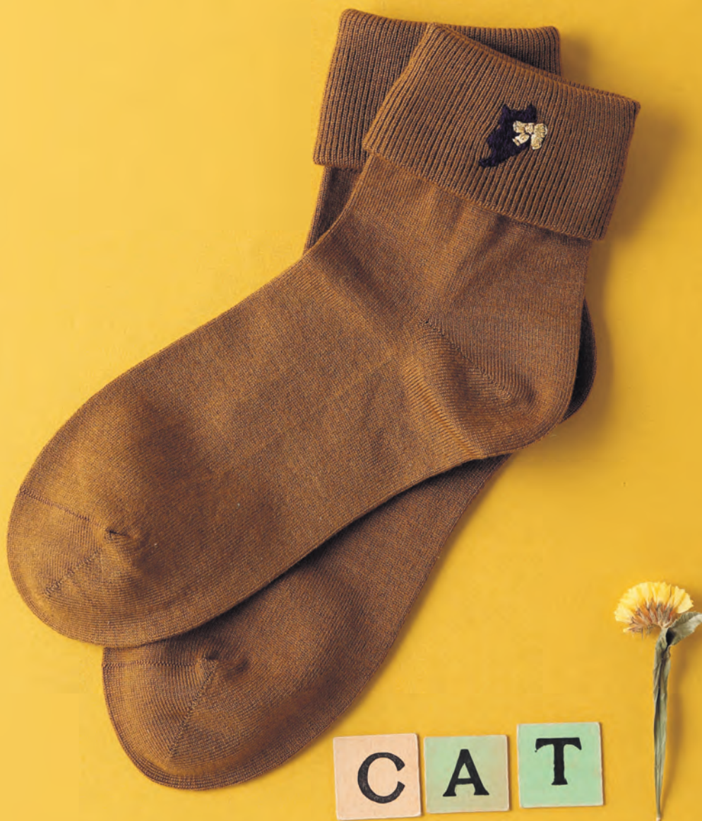
Фото на с. 31 (121)

Один маленький штрих превратит однотонные носки в стильный аксессуар.