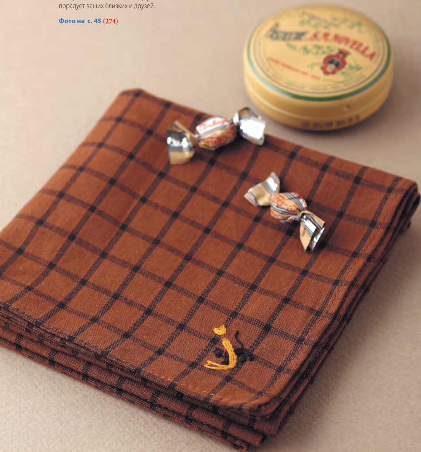
Фото на с. 45 (274)

Носовой платок с «кошачьими» инициалами в качестве подарка порадует ваших близких и друзей.