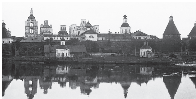
2 Соловецкий монастырь в период размещения в нем Соловецкого лагеря особого назначения. 1932 г.

колючей проволокой всю Россию. К концу 1930 года в лагере было более 70 тысяч заключенных. Среди них — академики и профессора, писатели и поэты, философы и актеры, политработники и военные, аристократы и крестьяне, женщины и дети, епископы и священники, православные и католики.