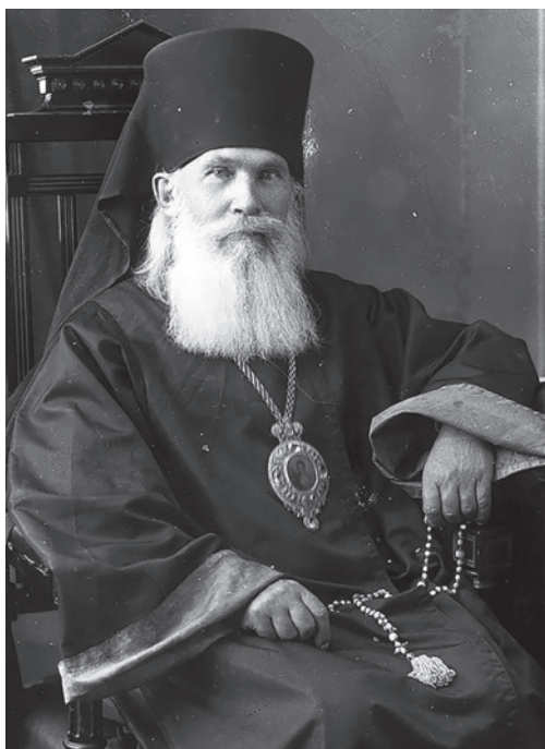
1 Лукояновский Свято-Тихоновский монастырь. Фото нач. XX в.