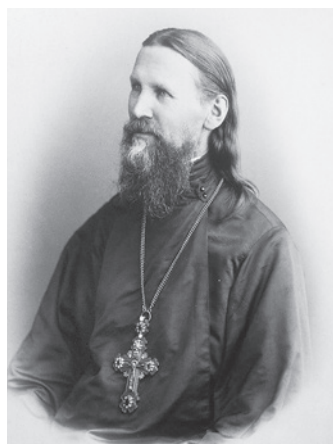
2 Прав. Иоанн Кронштадтский