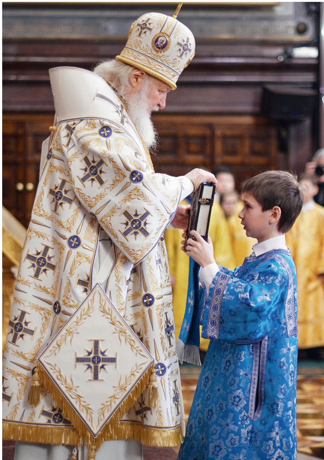
Литургия в Неделю о блудном сыне в Храме Христа Спасителя. 16 февраля 2020 г.