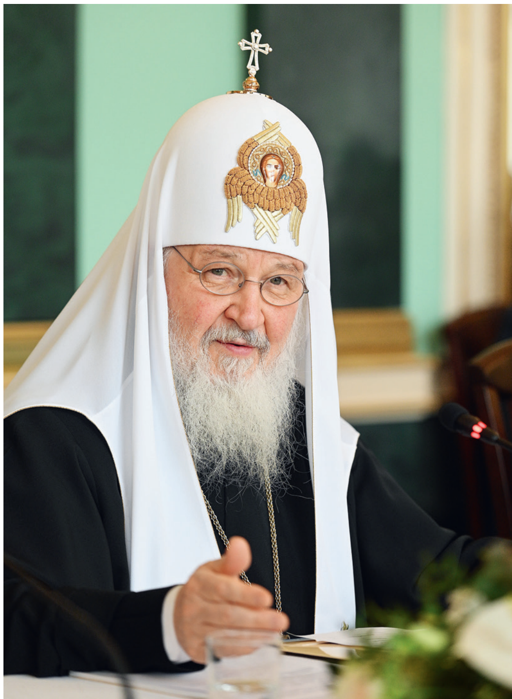
Святейший Патриарх Кирилл на Объединенном заседании Межрелигиозного совета России и Христианского межконфессионального консультативного комитета. 28 февраля 2020 г.