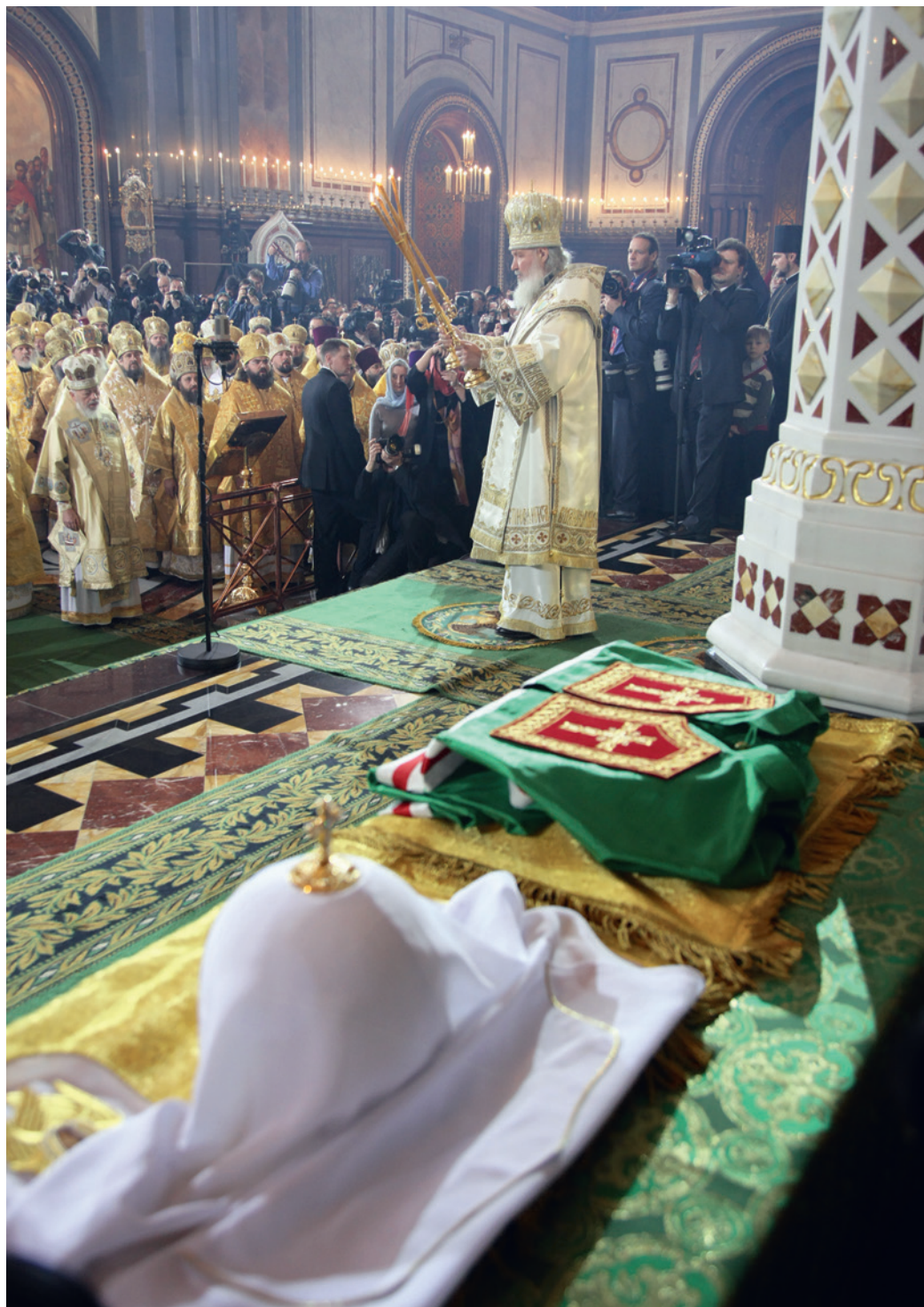
Инtronизация Патриарха Московского и всея Руси Кирилла. 1 февраля 2009 г.