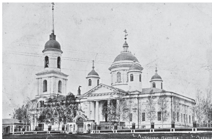
1 Покровский собор г. Лукоянова