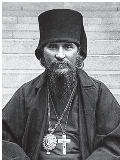
Архиепископ Евдоким (Мещерский)

4 июля 1918 года епархиальным архиереем был избран Тифлисский митрополит священномученик Кирилл (Смирнов). По предложению Патриарха Московского и всея России святителя Тихона митрополит Кирилл отказался от Нижегородской кафедры в связи со сложным положением в закавказских епархиях.