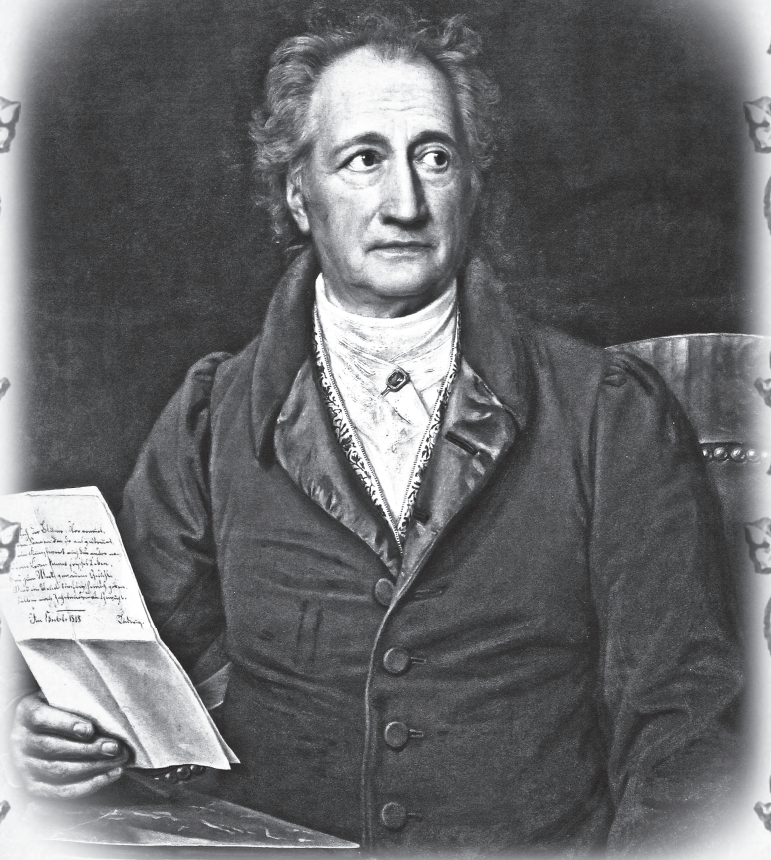
Иоганн Вольфганг фон Гёте (1749-1832)