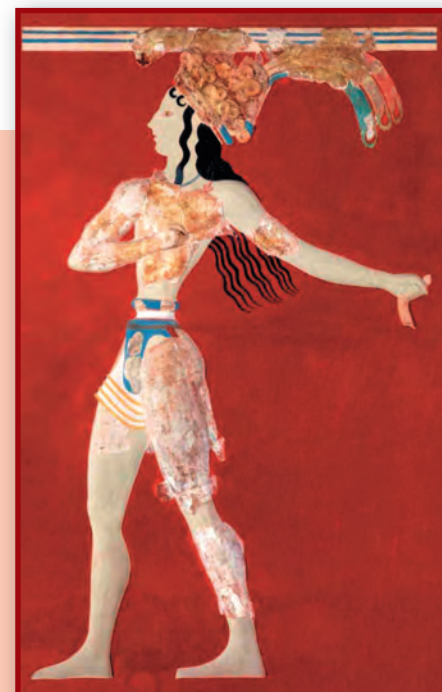
«Царь-жрец». Раскрашенный рельеф Кносского дворца. Ок. 1550 г. до н.э.

VII–VI вв. до н.э. принято называть периодом архаики (от греческого слова «архайос» – древний), в это время в греческом искусстве постепенно складывается система архитектурных форм, явившаяся основой для дальнейшего развития зодчества. Основным типом храма в это время становится периптер – здание прямоугольной формы, окруженное со всех сторон колоннадой. Формируется и особая система ордеров – дорический и иониче-