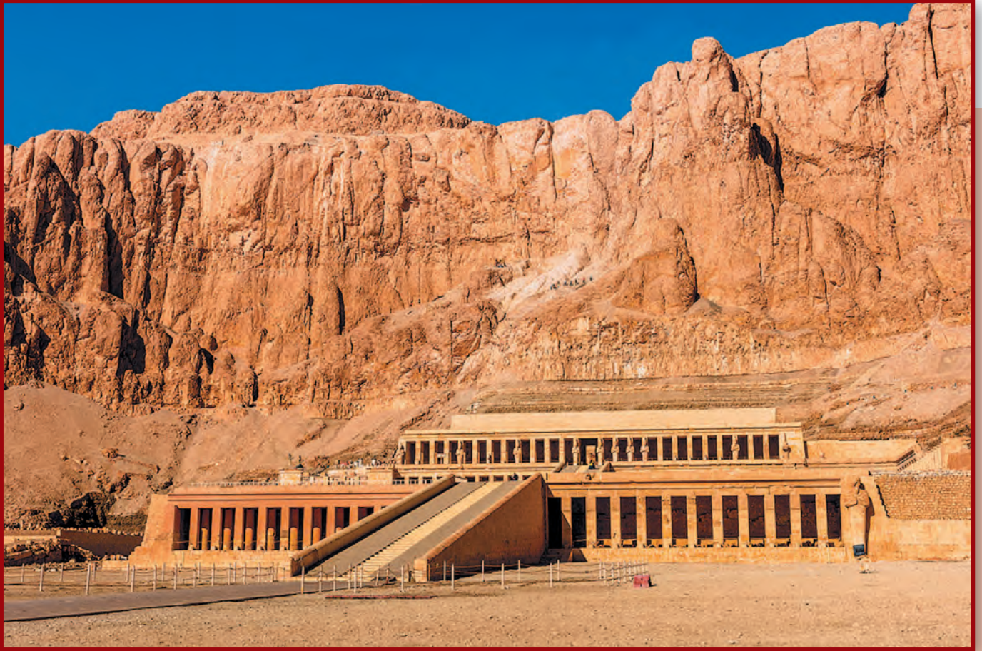
Архитектор Сенмут. Храм царицы Хатшепсут в Дейр-эль-Бахри. Конец XV в. до н.э.

Храм царицы Хатшепсут являлся заупокойным. К святилищу, высеченному в скале, ведут три террасы, соединенные пандусами. В древности дорога к храму представляла собой скульптурную аллею сфинксов.