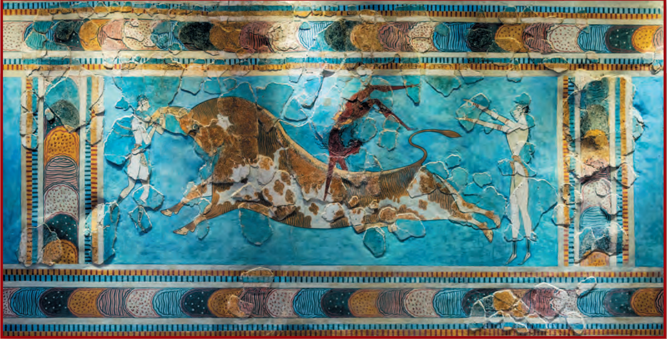
Акробаты с быком. Фрагмент фрески Кносского дворца. Крит. Ок. XV в. до н.э.

Считается, что именно критские мастера первыми начали использовать технику фрески – росписи по сырой штукатурке. Однако созданные ими памятники дошли до нас лишь во фрагментах, которые были живописно дополнены в XX в.