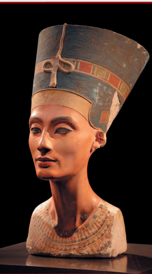
Мастерская Тутмоса. Бюст Нефертити. Египет. Ок. 1345 г. до н.э.

Храм царицы Хатшепсут являлся заупокойным. К святилищу, высеченному в скале, ведут три террасы, соединенные пандусами. В древности дорога к храму представляла собой скульптурную аллею сфинксов.