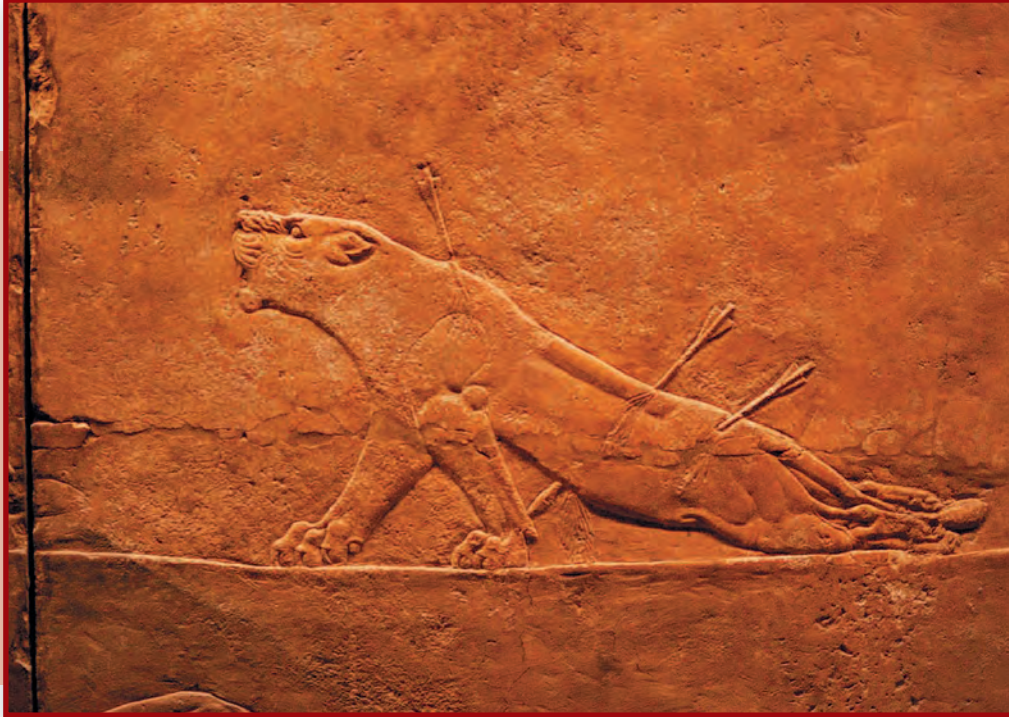
Раненая львица. Фрагмент рельефа из дворца царя Ашшурбана- пала в Ниневии. Ок. 669–635 гг. до н.э.

Сцены львиной охоты из ассирийских дворцов полны драматизма. Древнему мастеру удалось создать один из самых реалистичных в истории искусства образов умирающего животного.