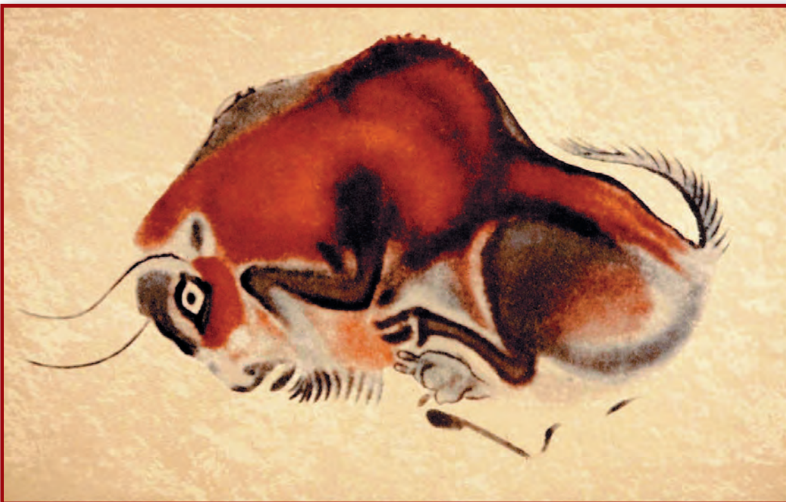
Изображение бизона из пещеры Альтамира. Ок. 15 тыс. л. до н.э.

и головой льва, в соответствии с последними научными исследованиями ее возраст составляет около 40 000 лет. И если в первобытной живописи изображения человека встречаются нечасто, то в скульптуре довольно широкое распространение получили «палеолитические Венеры» – небольшого размера женские фигурки с подчеркнуто гипертрофированными формами груди, живота и бедер. Обычно они вырезались из кости и камня, но также встречаются вылепленные из глины статуэтки, обожженные огнем для придания материалу большей прочности. Вероятнее всего, такие «Венеры» явля-