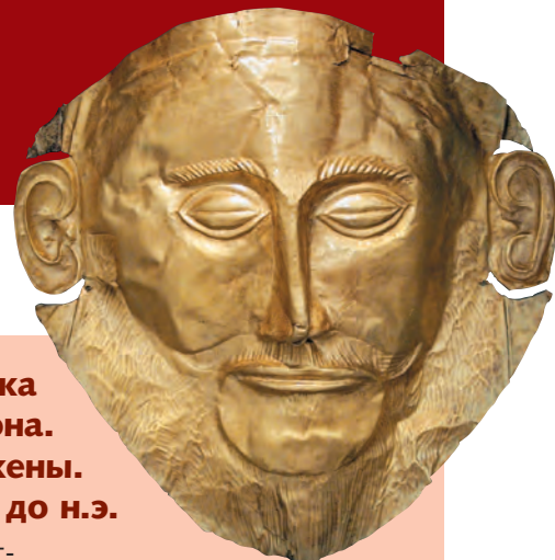
Маска Агамемнона. Микены. 1550–1500 гг. до н.э.

Эпоха блестящего расцвета культуры и искусства охватывает первую половину II тыс. до н.э., когда главенствующее место занимает остров Крит, где в начале XX в. археологом Артуром Эвансом был обнаружен знаменитый Кносский дворец. Особенностью строительной техники дворца, возведенного из камня и кирпича-сырца, являются деревянные колонны на каменном основании, расширяющиеся вверх. Стены парадных залов дворца были украшены фресками с изображениями человеческих фигур, животных и растений. Особое значение критяне придавали образу быка, о чем свидетельствуют архитектурные детали, произведения живописи, скульптуры и декоративно-прикладного искусства. Весьма вероятно, что сложная структура дворца, имеющего множество этажей и помещений, и многочисленные изображения