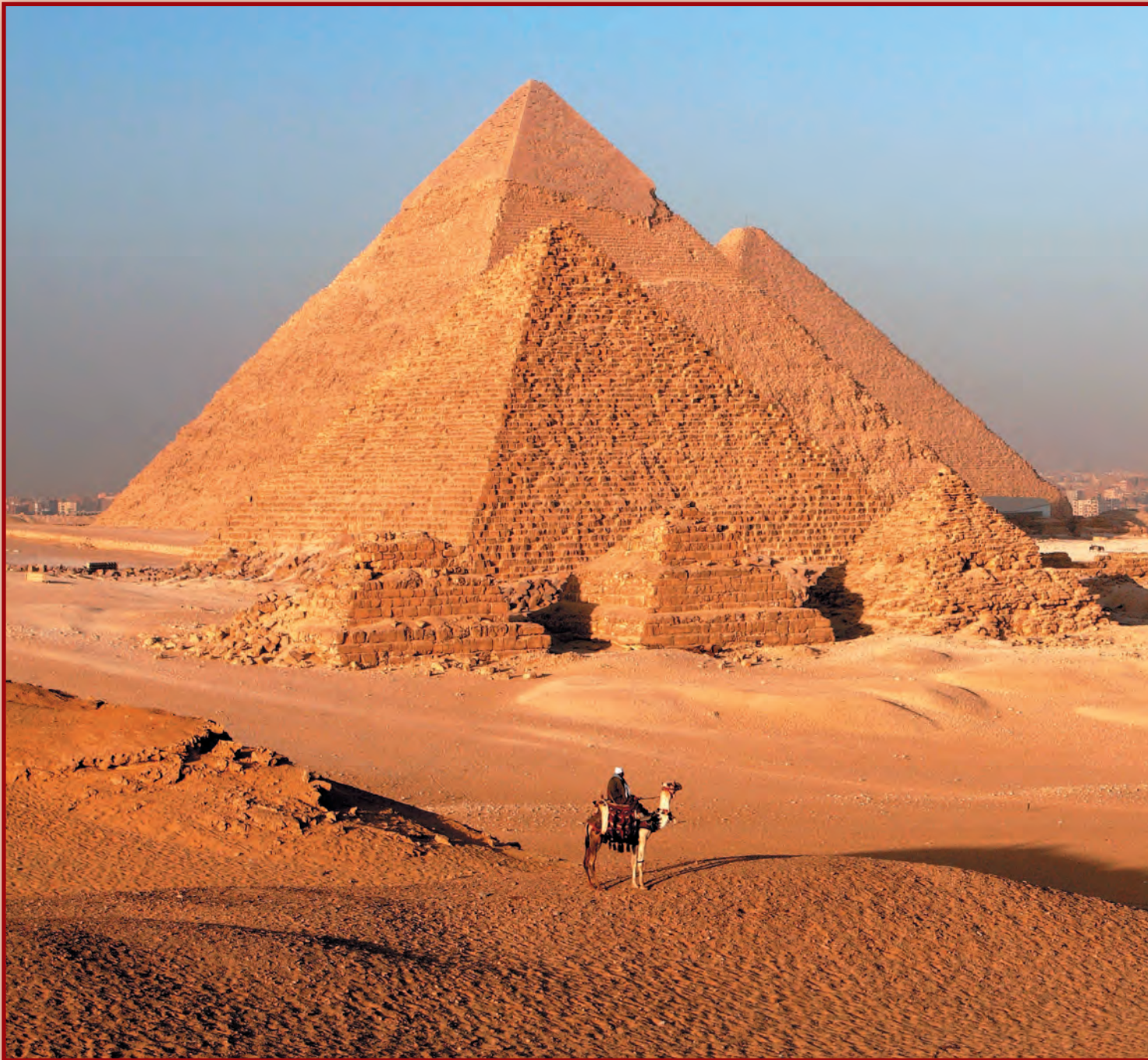
Комплекс пирамид в Гизе. Египет

Знаменитые пирамиды в Гизе – гробницы фараонов Хеопса, Хефрена и Микерина – вместе с монументальной фигурой охраняющего их Большого сфинкса являются частями обширного некрополя. Их возведение датируется эпохой Древнего царства, правлением представителей IV–V династий (XXVI–XXIII вв. до н.э.). До сих пор ведутся споры о том, каким образом