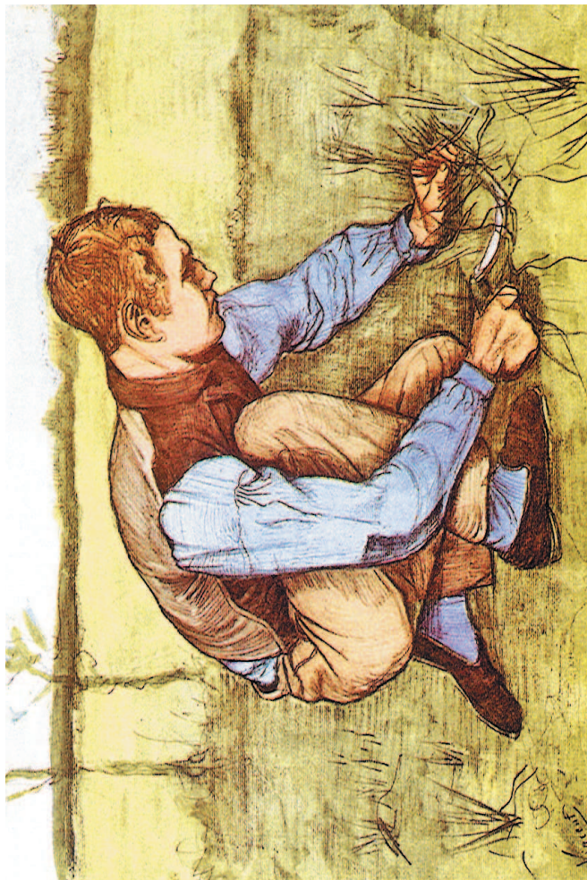
Мальчик, обрезающий траву серпом. 1881