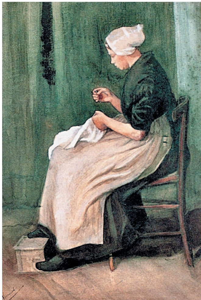
Схевенинген. Девушка шьет. 1881