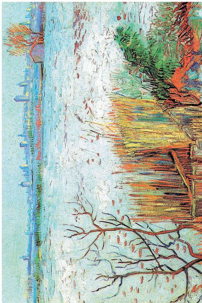
Заснеженный пейзаж с Арлем на заднем плане. 1880