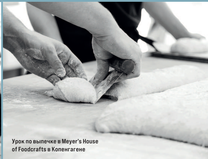
Урок по выпечке в Meyer's House of Foodcrafts в Копенгагене