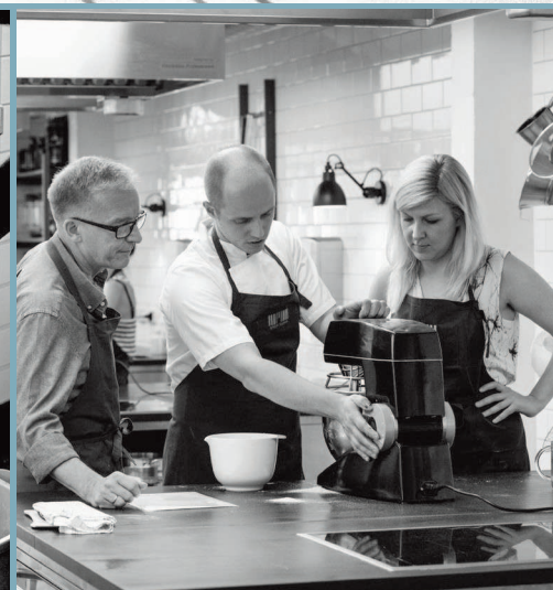
Урок по выпечке Meyer's House of Foodcrafts в Копенгагене