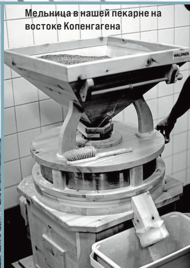
Мельница в нашей пекарне на востоке Копенгагена