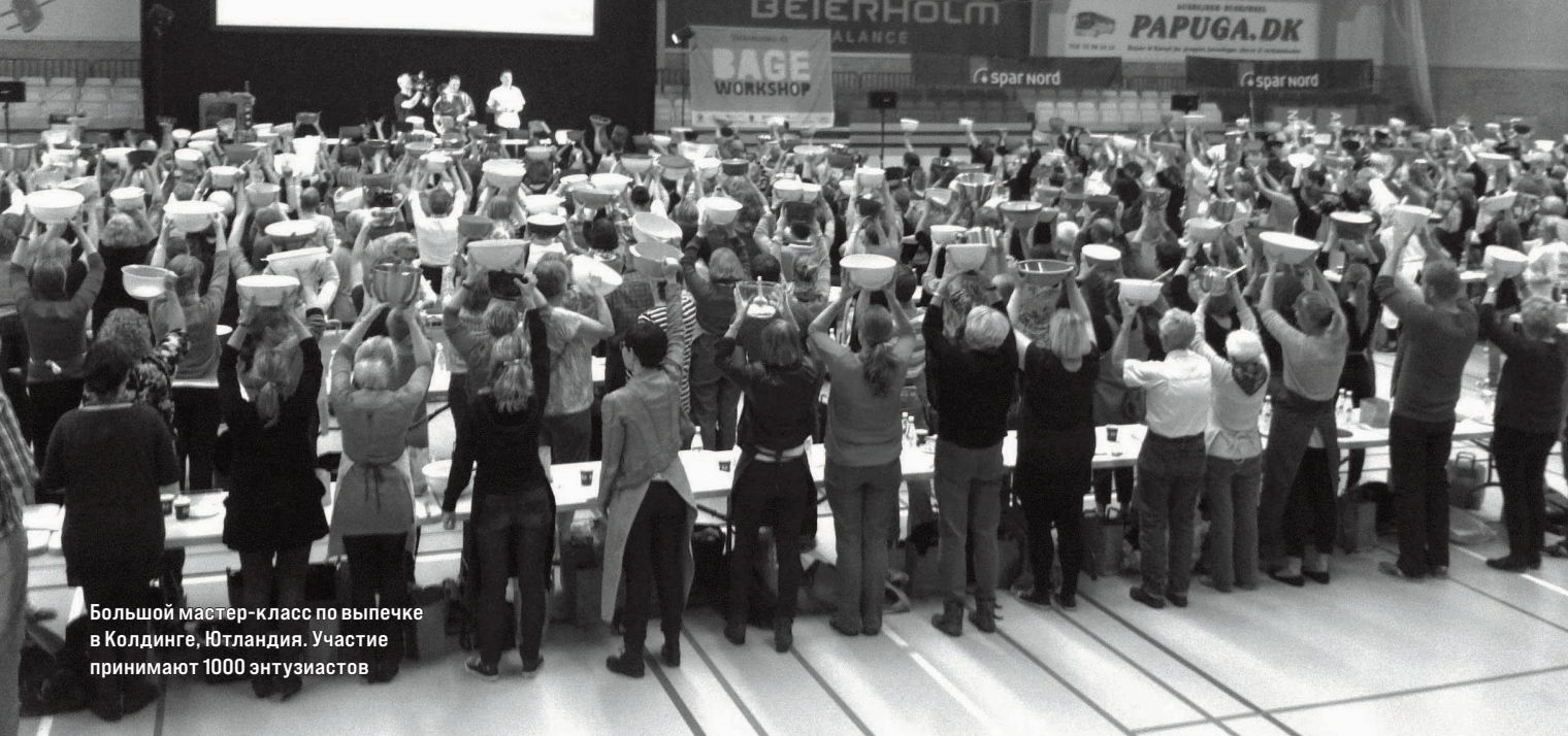
Большой мастер-класс по выпечке в Колдинге, Ютландия. Участие принимают 1000 энтузиастов