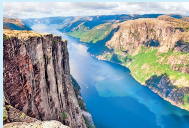
Вид на Люсе-фьорд и плато Кьёраг