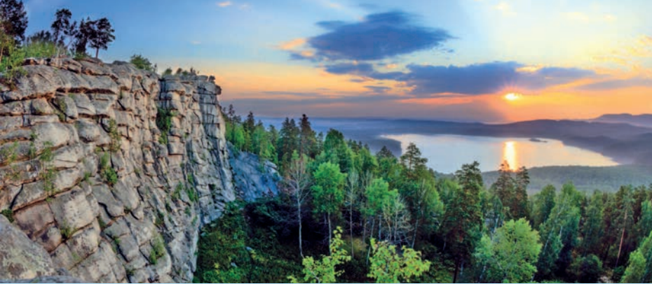
Средний Урал, Россия