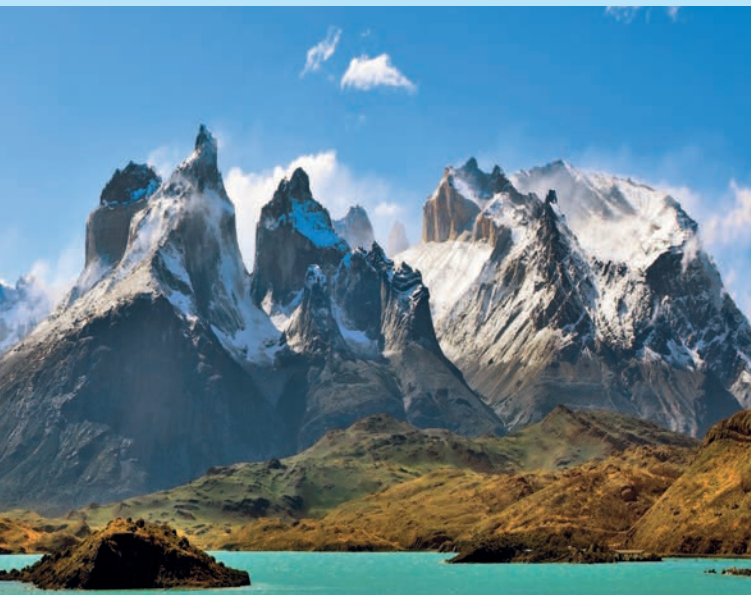
Скалы Лос-Куэрнос в парке Торрес-дель-Пайне, Чили