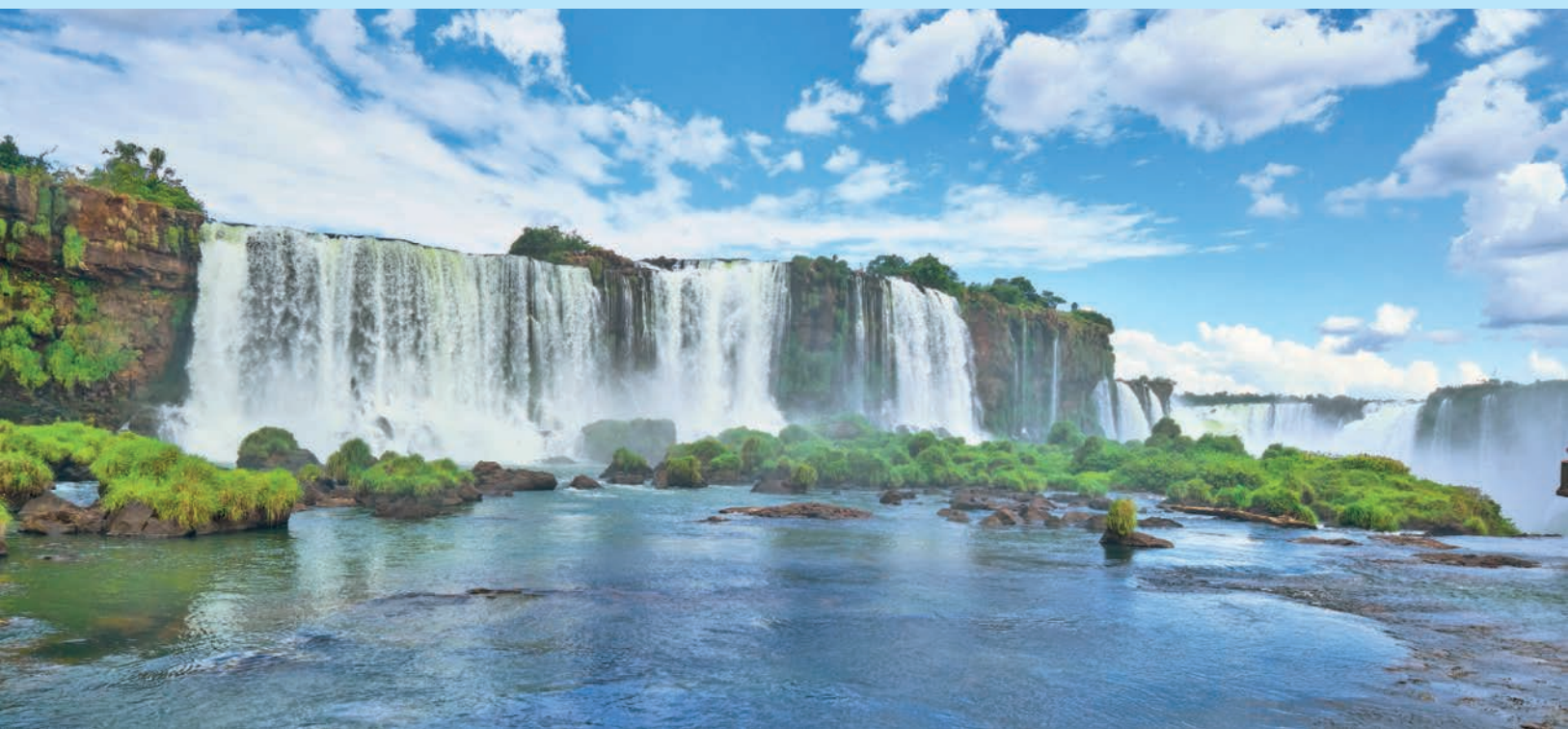
Водопады Игуасу, Аргентина