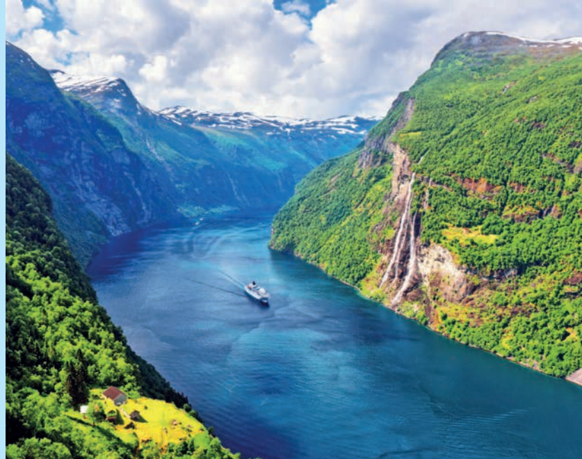
Вид на фьорд и водопады Семь Сестер