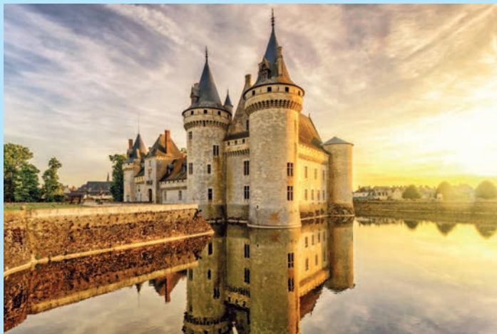
Шато де Сюлли-сюр-Луар на закате, Долина Луары, Франция.

Самое маленькое государство Европы – Ватикан, резиденция Папы Римского. Ватикан отделился от Италии в 1929 году. Его площадь так мала, что целиком уместается в пределы Рима.