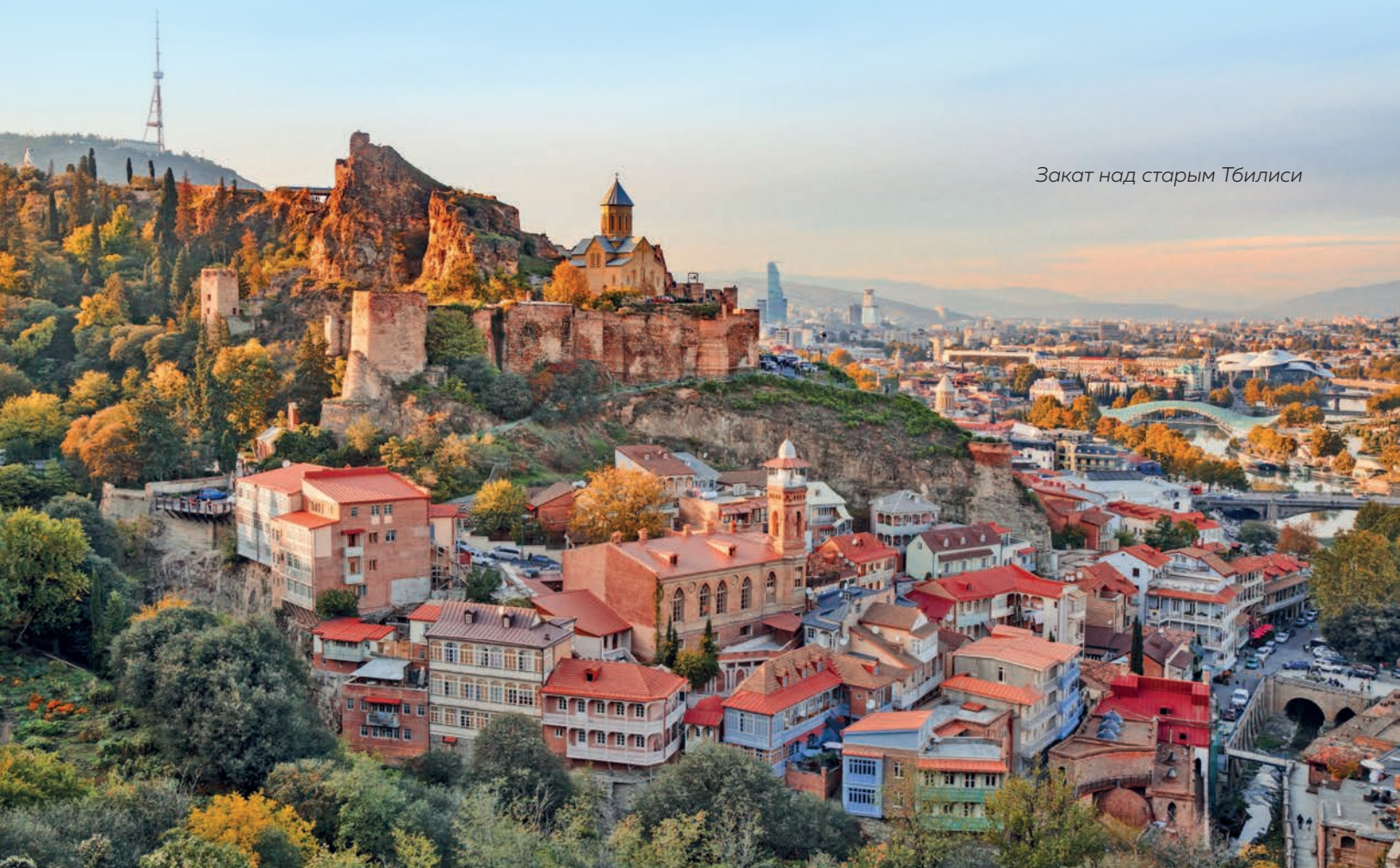
Закат над старым Тбилиси