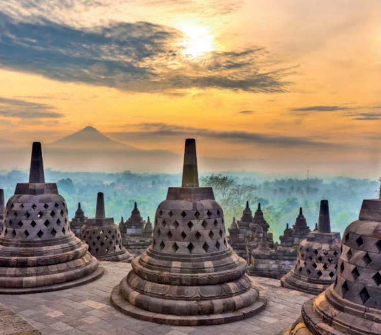
Восход на Борободуре, Индонезия