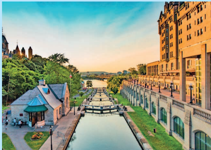
Канал Ридо в Оттаве, Канада