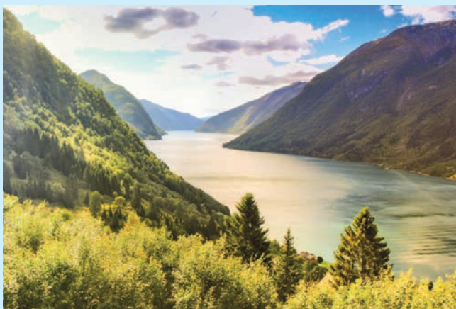
Согне-фьорд — самый большой фьорд в Норвегии

Выбрать самые красивые норвежские фьорды — непростая задача. Ведь таких заливов в Норвегии