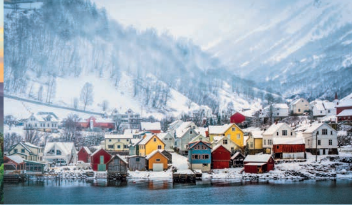
Дома на берегу норвежского фьорда

странение христианства. Религия преобразовала мышление людей и облик мест, которые те строили. Монастыри, замки, города-крепости с узкими улочками: новая эпоха диктовала новые условия жизни и всеми силами боролась с языческим миром. Память о Средневековье хранят остатки поселений викингов в норвежских фьордах, мрачноватый исторический центр Барселоны, некоторые из самых старых замков Луары.