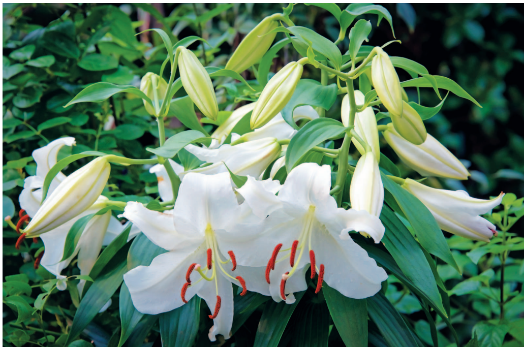
Лилии сорта «Касабланка»

Много лет я старался как можно реже использовать в работе лилии. Все хорошо знают эти красивые ароматные цветы. Чем же они мне не угодили? Возможно, дело в том, что в детстве, когда я был еще школьником и учился в младших классах, мои родители занимались продажей цветов. Жили мы тогда в Кишиневе (Молдавия) в частном доме. В то время очень популярны были лилии, особенно сорта «Касабланка» — красивые, крупные и с невероятно сильным ароматом. И когда приезжала очередная партия лилий, а это триста — четыреста стеблей, родители ставили их в большие чаны (примерно в такие, в каких в школах готовят суп сразу на несколько классов) и размещали в прохладном подвале.