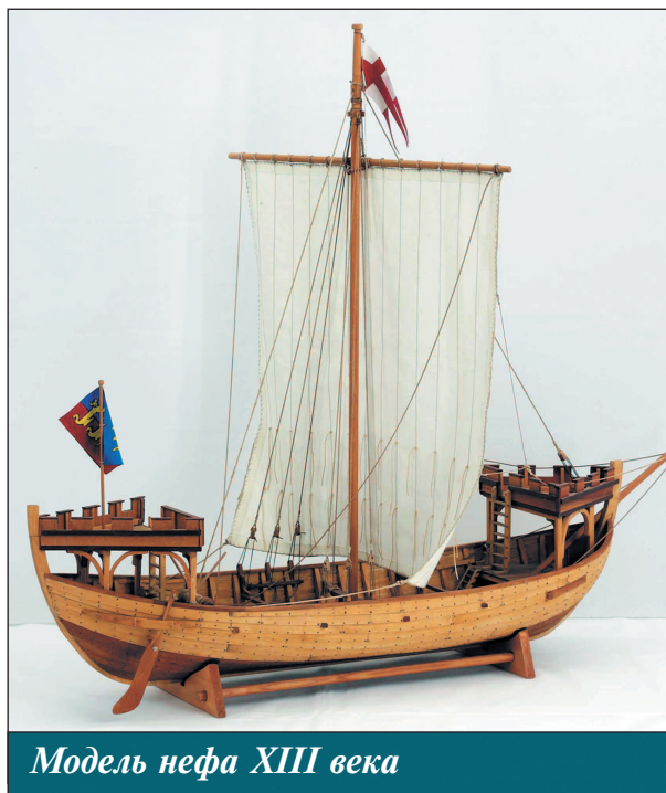
Модель нефа XIII века

В Северной Европе примерно в это же время строили когги — одномачтовые суда с широким корпусом и традиционной