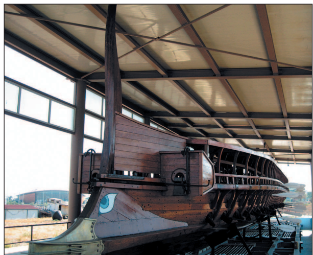
«Олимпия» — современная реконструкция древнегреческой триеры

Прямыми наследниками античных судостроительных традиций стали византийцы. Они строили дромоны, имевшие по две мачты, два ряда весел и вооружавшиеся катапультами. Серьезное превосходство византийскому флоту над противником давал «греческий огонь» —