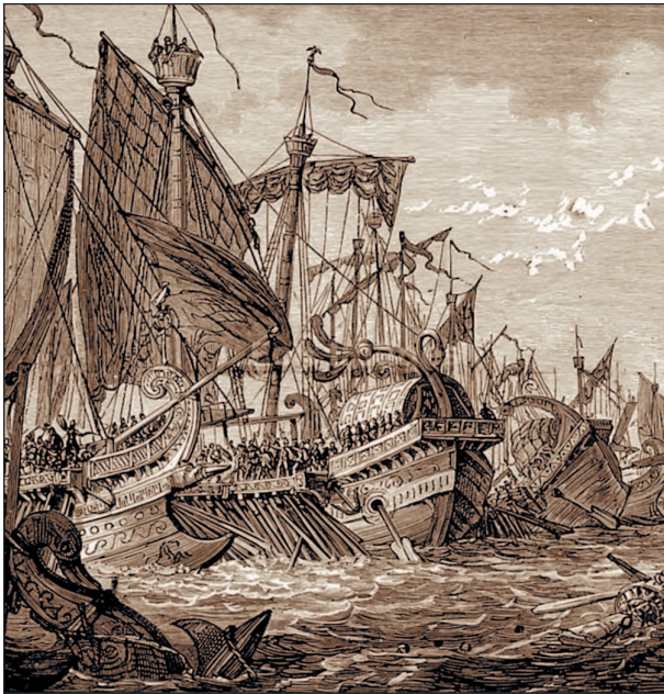
Первая Пуническая война, сражение при мысе Экном

полнительный — артемон, располагавшийся на наклонной мачте в носовой части судна. Однако основным двигателем у трирем служили все же весла. Во время боя паруса и мачты убирали.