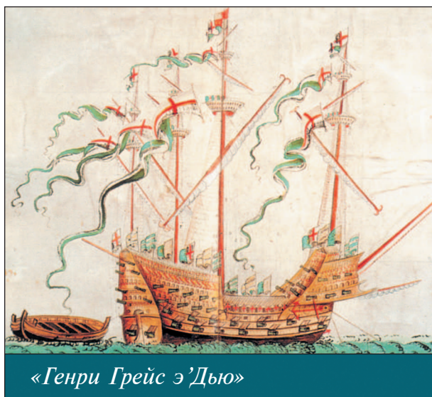
«Генри Грейс э'Дью»

называл свой флагманский корабль «Санта Мария» Христофор Колумб.