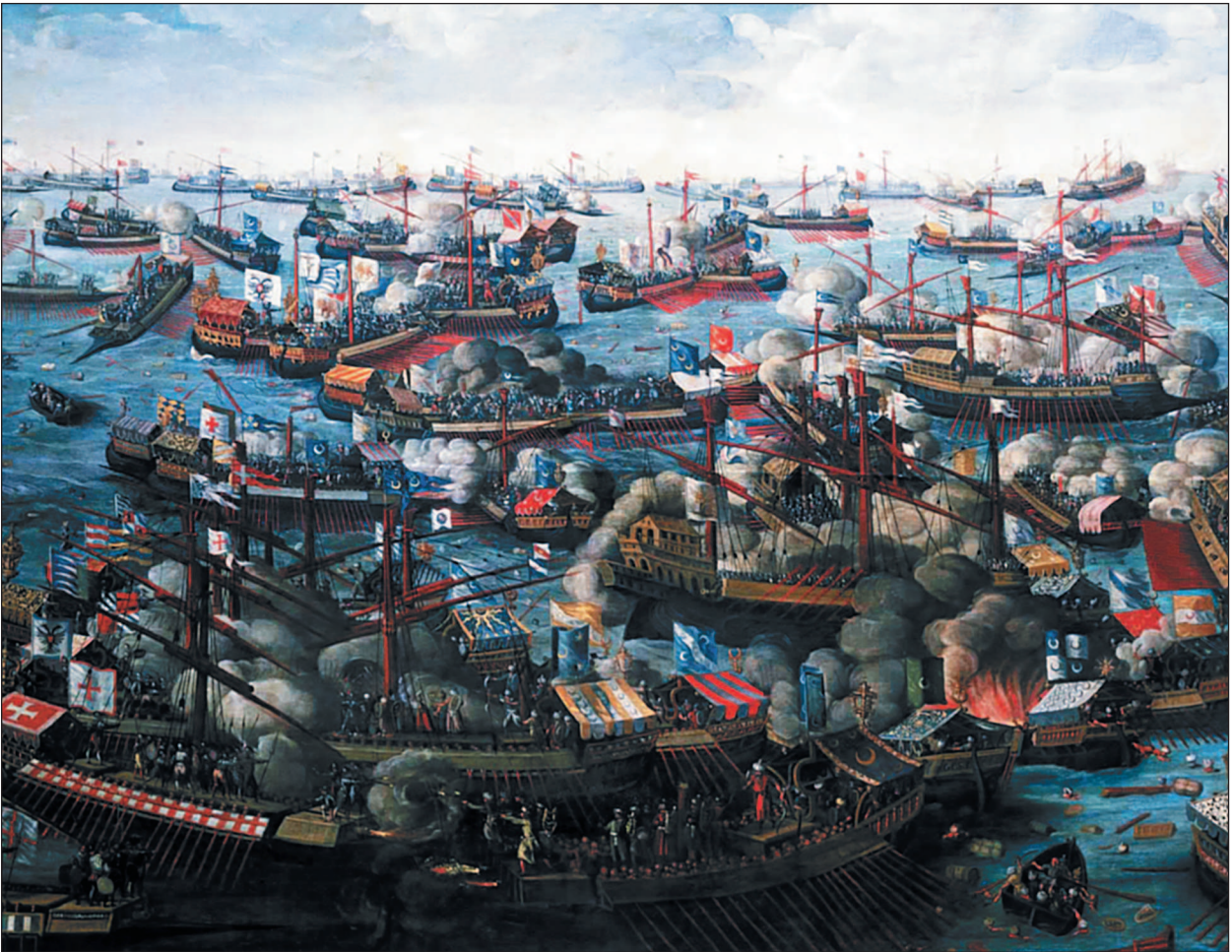
Сражение при Лепанто

Начиная с XVII в. боевое значение галер резко упало, так как развитие парусных судов обеспечило им превосходство практически по всем параметрам. В ряде случаев сохранившиеся галеасы переделывали в полноценные парусные суда. В частности, так в 1570 г. поступили англичане, переделав в галеоны два своих галеаса.