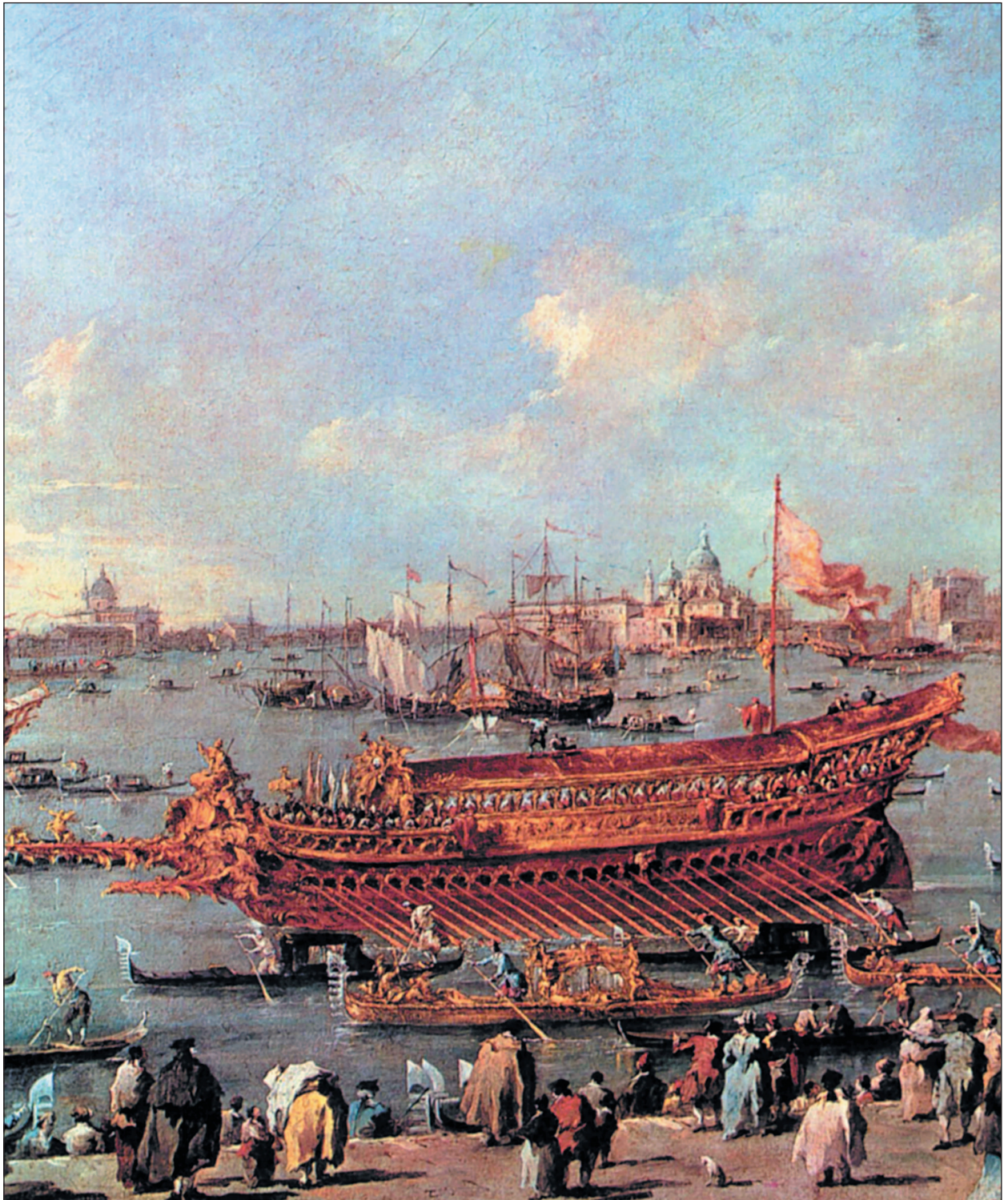
Галера дожа Венеции «Буцентавр». Картина Франческо Гварди