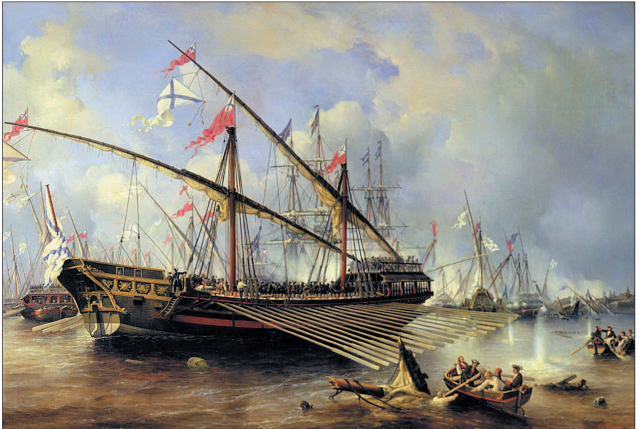
Русская галера в сражении при Гренгаме

Что же касается галеасов, то они постепенно трансформировались в легкие гребные фрегаты с полным парусным вооружением, у которых вместо одной из