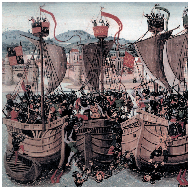
Сражение при Слейсе. Гравюра XV века

Со временем термин «каракка» постепенно начал замещаться заимствованным из испанского языка «нао». Именно так