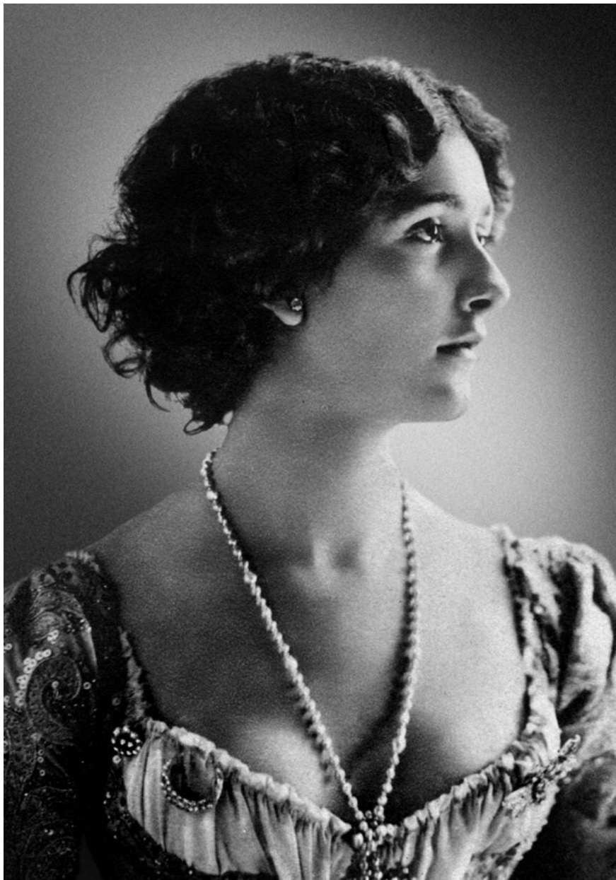
«Дебютантка в концертном кафе», 1890-е годы