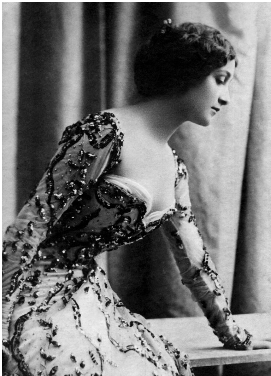
Лина Кавальери, 1900-е годы