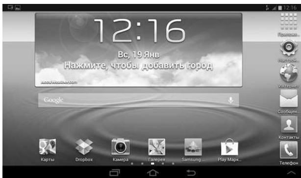
Рис. 1.6. Главный экран Android 4.1 Jelly Bean

Jelly Bean — такое название получила версия Android 4.1 (рис. 1.6), которая была выпущена 27 июня 2012 г.