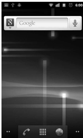
Рис. 1.3. Главный экран Android 2.3 Gingerbread