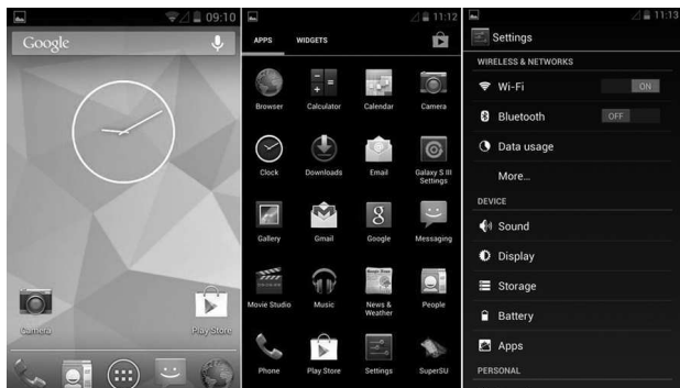
Рис. 1.7. Интерфейс Android 4.2 Jelly Bean

В очередной версии ОС были обновлены некоторые приложения, исправлены недочеты и скорректированы отдельные функции. Отличительной чертой Android 4.2 Jelly Bean (рис. 1.7) стала возможность быстрого переключения между профилями пользователей.