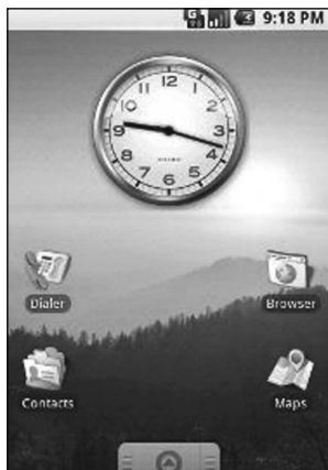
Рис. 1.1. Главный экран Android 1.5 CupCake