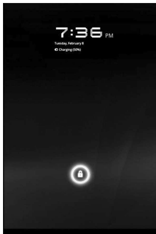
Рис. 1.4. Экран блокировки Android 3.0 Honeycomb