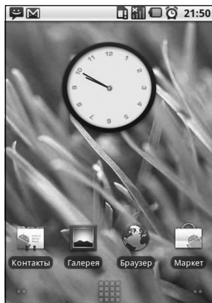
Рис. 1.2. Главный экран Android 2.1 Eclair

и виджеты, поддержку Bluetooth и дисплеев с разрешением 800 \times 400 пикселей.