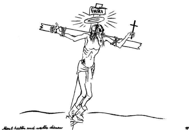
1. Георг Гросс. Распятие, 1927 г.

в сцене Распятия (сапоги и противогаз), однако главным камнем преткновения стала надпись, помещенная в углу рисунка: « Maul halten und weiter dienen » — «Заткнись и делай, что положено!»