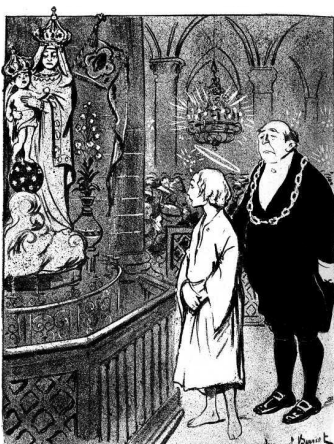
3. Эммуэль Барсе. Как Иисус провел Сочельник. Сатирический рисунок из журнала «Assiette au beurre» (21 декабря 1907 г.)

LE BÉBÉ JÉSUS. — C'est la Sainte Vierge... JÉSUS. — Pauvre maman ! Elle qui était si jeune !