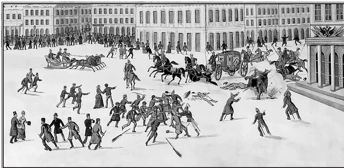
Неизвестный художник. Убийство Александра II 1 (13) марта 1881 года