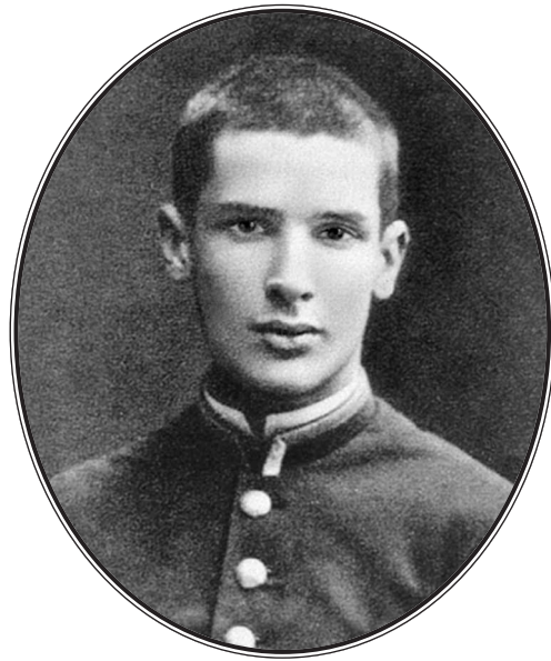
Ученик Виленской гимназии Петр Столыпин. 1876 г.

в Министерстве внутренних дел, но через два года перешел в ведомство земледелия и государственных имуществ. Затем он снова поступил в Министерство внутренних дел и занял должность предводителя дворянства в Ковенском уезде (в Западном крае, как известно, предводители дворянства служат по назначению). Из газетных сообщений известно, что в Ковенской губернии у П. А. Столыпина есть имение. В 1899 г. П. А. Столыпин был назначен ковенским губернским предводителем дворянства, а в 1902 г., при В. К. Плеве*, он был определен исправляющим должность гродненского губернатора. При Плеве же П. А. Столыпин в 1903 г. получил назначение на пост саратовского губернатора, в то время считавшийся очень ответственным и трудным, так как губерния слыла «красной». 26 апреля 1906 г., в день падения первого русского «объединенного кабинета» графа Витте, П. А. Столыпин, еще молодой сравнительно человек, 44 лет, был назначен министром внутренних дел в кабинете