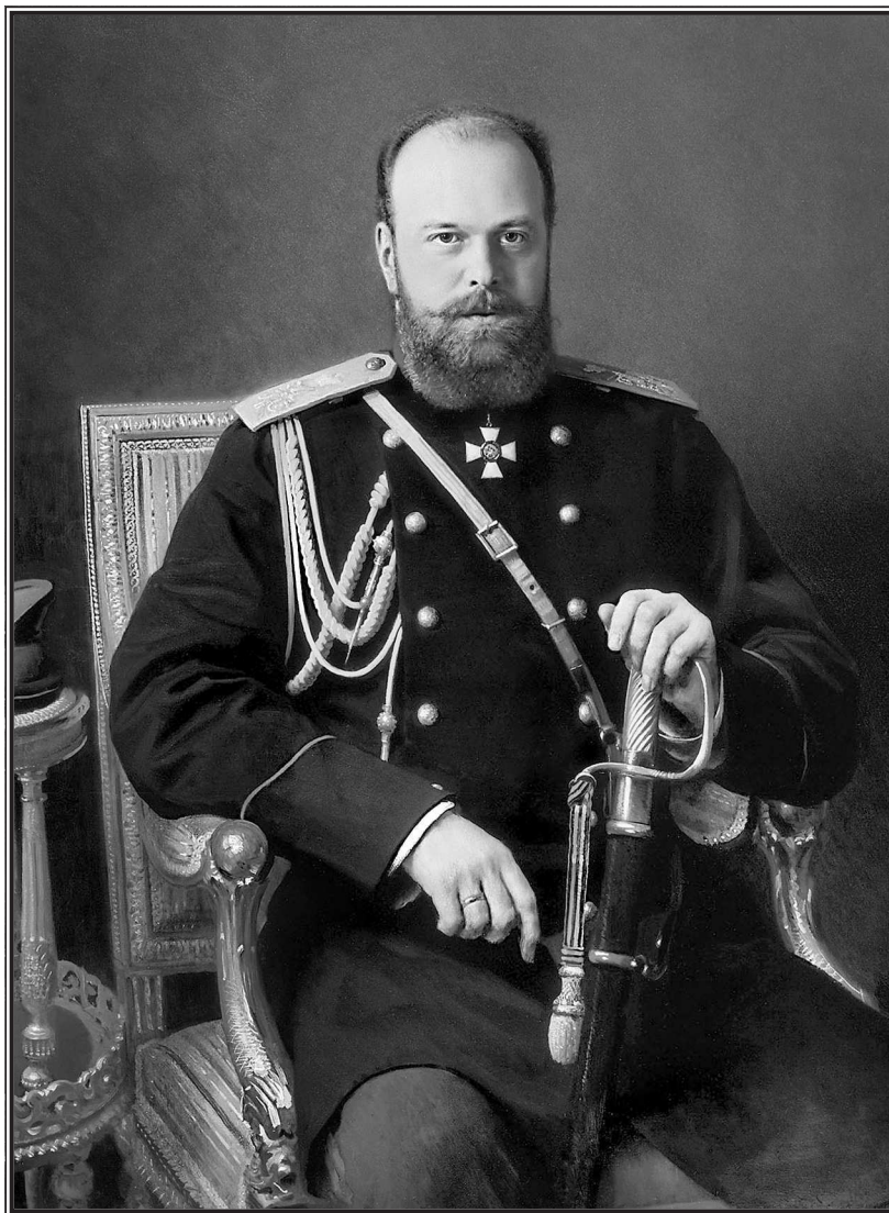
И. Н. Крамской. Император Александр III.