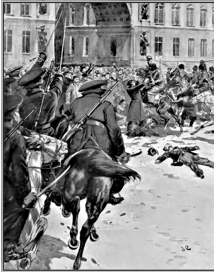
Казачи на Дворцовой площади разгоняют демонстрантов.

Иллюстрация из британского периодического издания. 1905 г.