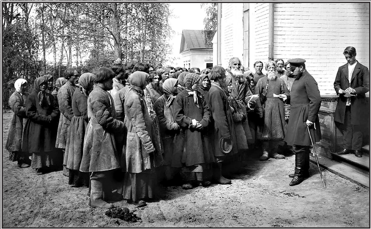
Голодный год. Нижегородские крестьяне у земского начальника в городе Княгинино.