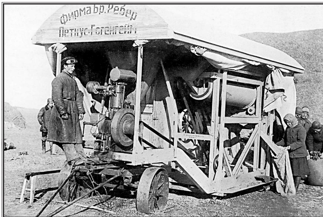
Машина для обмолота зерна фирмы «Братья Рёбер».