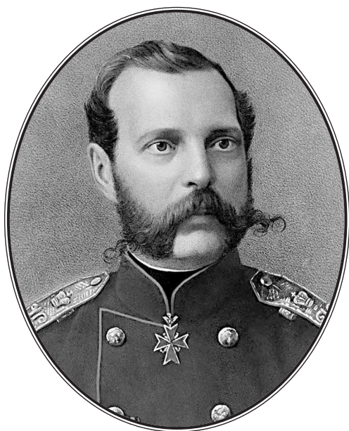
Император Александр II (1818—1881)

Реформы, произведенные в правление Александра II, вызвали значительный рост общественного недовольства. Появились первые революционеры-террористы. Первая попытка убийства царя была предпринята в 1866 г., а с 1880-х гг. терроризм становится в России массовым явлением.