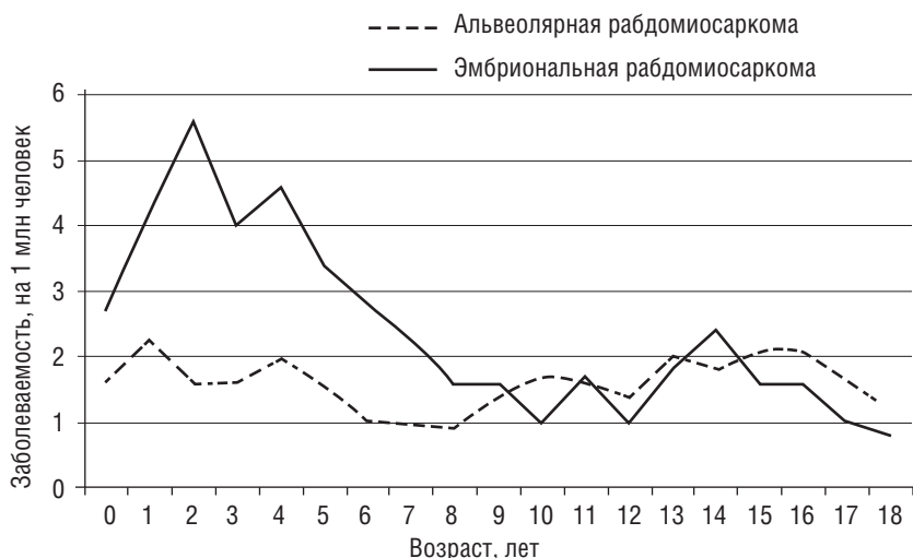
Рис. 1.3. Заболеваемость рабдомиосаркомой по возрасту и гистологическому варианту (SEER, 1975–2011)

Основываясь на данных программы SEER, мы знаем, что частота РМС различается как по возрасту, так и по гистологии (рис. 1.3). В частности, возникновение эмбриональных РМС (эРМС) имеет бимодальный пик, причем каждый пик приходится на основные периоды развития (то есть ранее