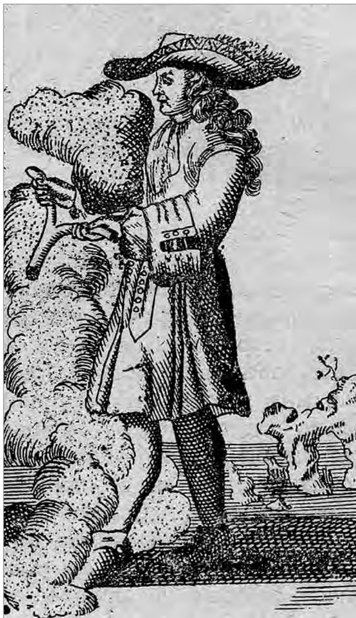
Жак Эймар на изыскании источников (Рисунок заимствован из Оккультной физики аббата Валлемона)

— Как находить источники и руду с помощью ореховой или металлической волшебной палочки