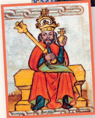
Карл Великий был первым императором в Центральной Европе с древних времён.

Снаружи слышатся громкие голоса: два графа спорят между собой и хотят, чтобы их пропустили к императору. Карл проходит вместе с ними и советниками в большой зал и через некоторое время улаживает дело, он чуток и справедлив. Теперь император может обратиться к сенешалю и маршалу, с которыми он обсуждает дела военные. Карл много путешествует, чтобы править своей огромной империей. И он