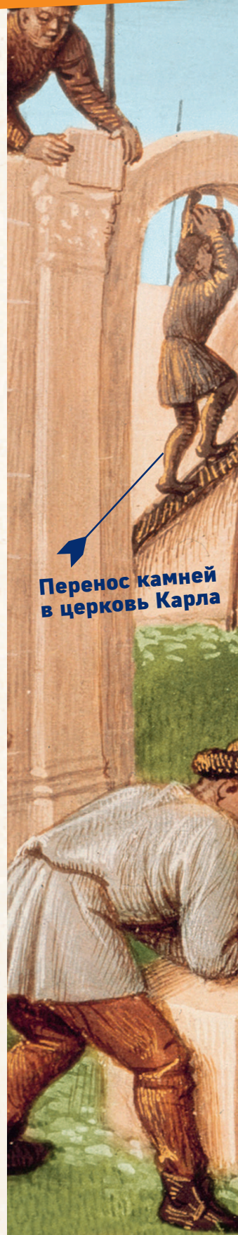
Перенос камней в церковь Карла