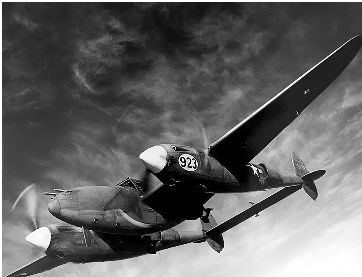
Прототип истребителя XP-80

из командования «Лехфельд». А уже 8 августа пилоты последнего одержали первую подтвержденную победу, сбив над озером Аммерзе «Москито» из 540-й Sqdn. RAF. Кто бы тогда мог подумать, что поршневая авиация, на создание и совершенствование которой было потрачено столько сил и средств, всего через несколько лет уступит первенство реактивной. А уже в следующей серьезной войне — в Корее — последняя будет играть первую скрипку.