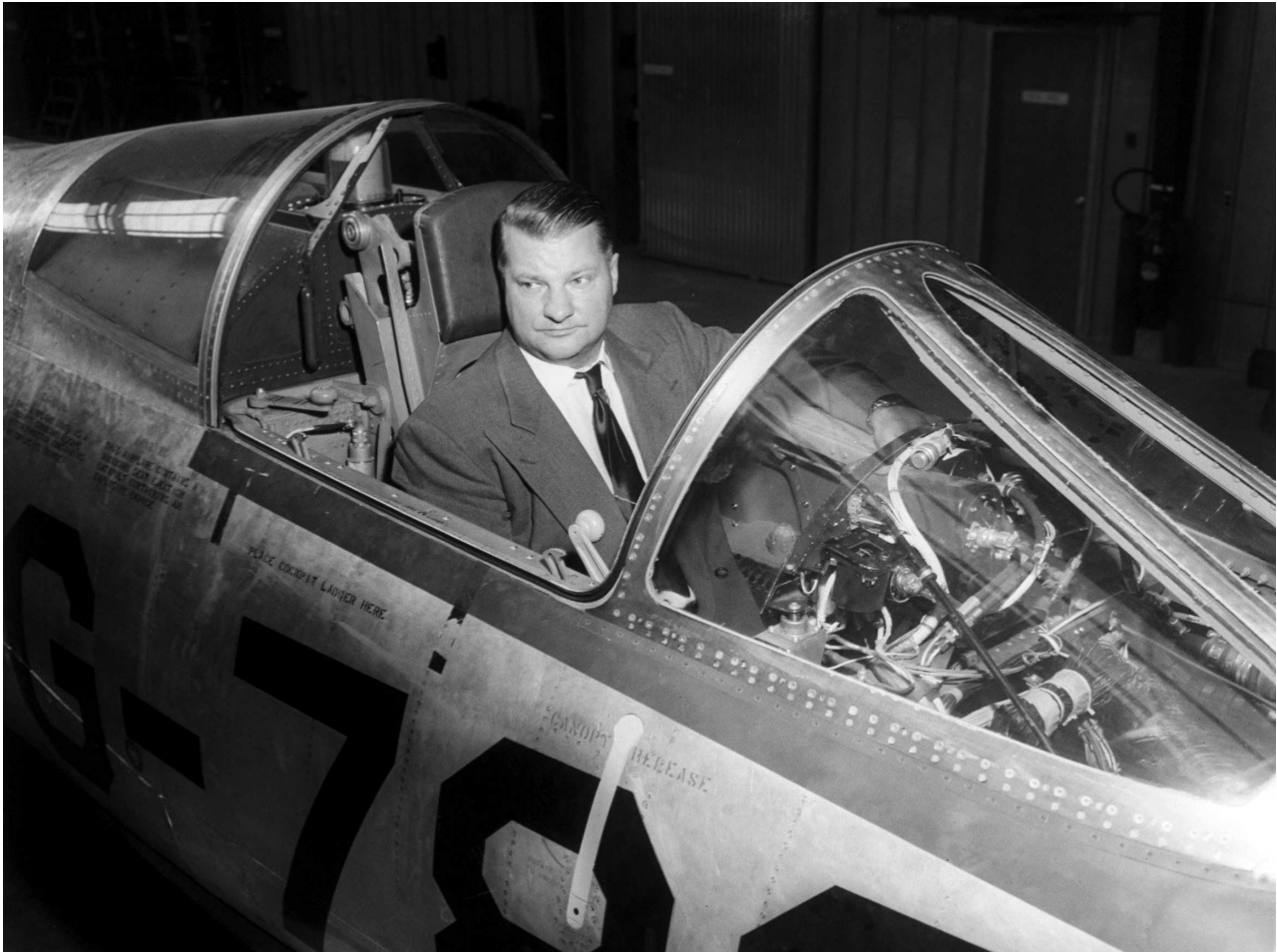
Конструктор Кларенс Джонсон в кабине F-104

Тихом океане. Для полетов на большие расстояния также использовались разведчики F-7 (модификация бомбардировщика B-24) и F-13 (модификация бомбардировщика B-29).