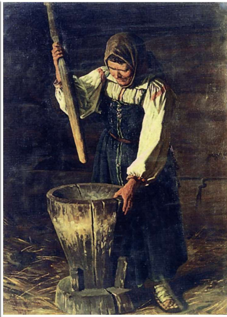
А. Протопопов «Старуха со ступой», 1878.

ху от семени. Таким образом, пестовать — очищать зерно от шелухи, отделять «плевелы 10 от зёрен». Вот поэтому того, кто занимался очищением ребенка, т. е. его воспитанием, возвращением, называли на Руси пестун или пестунья .