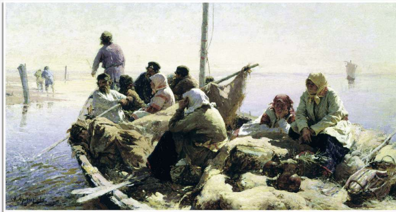
А. Архипов «По реке Оке», 1889.

уклад. В. Даль утверждал, что матерщина мерзка, непристойна и скверна. В словаре Даля мы находим: